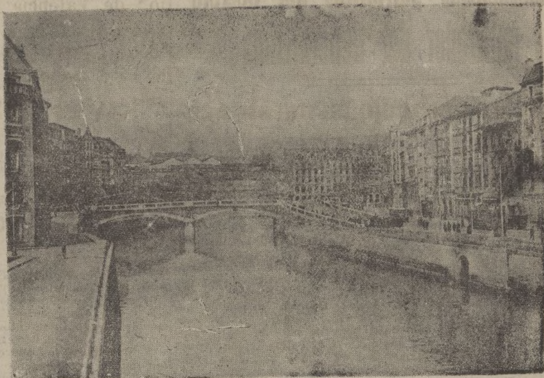
PUENTE DE LA MERCED