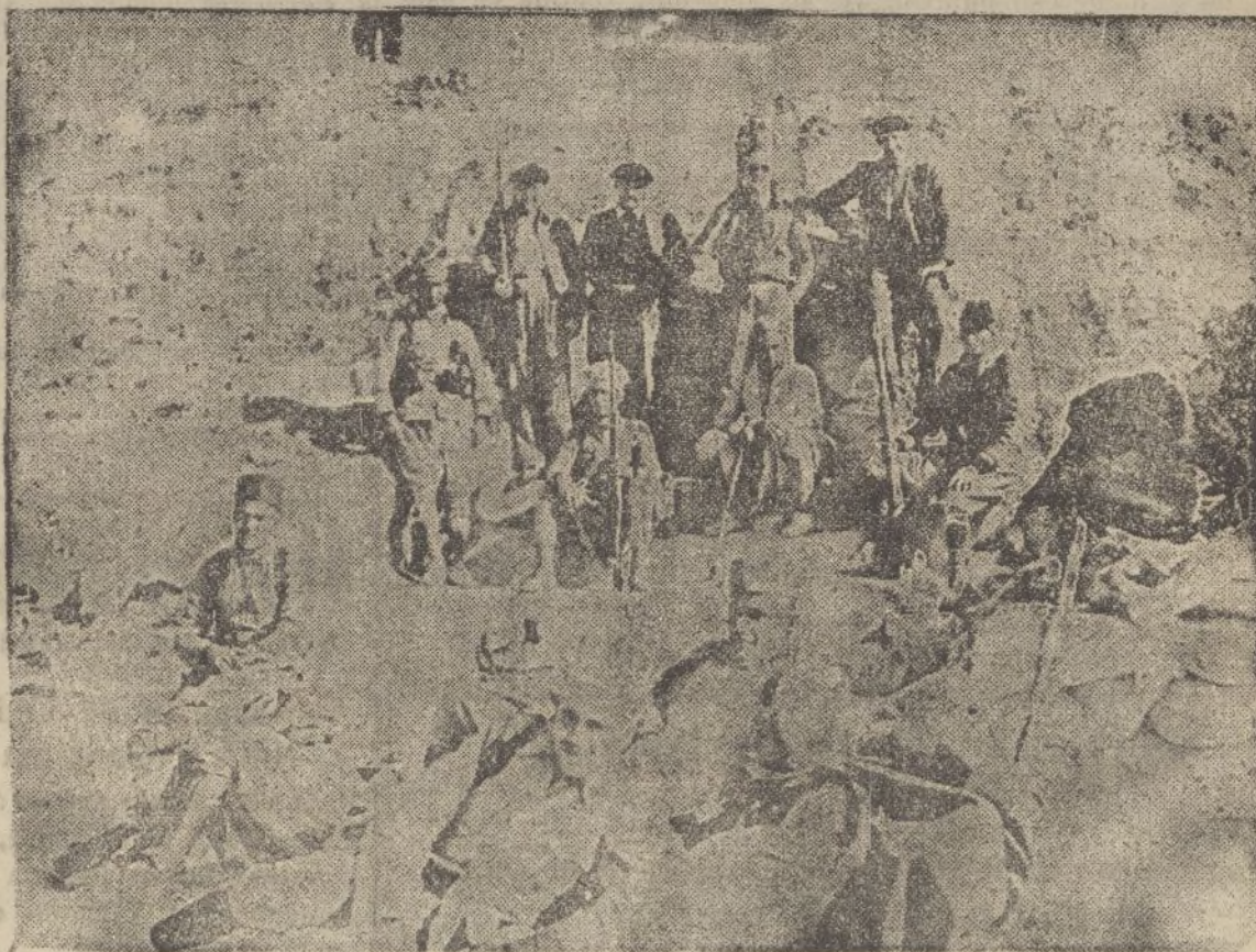
Un grupo de periodistas visitando una de las posiciones nacionales en el frente de batalla.