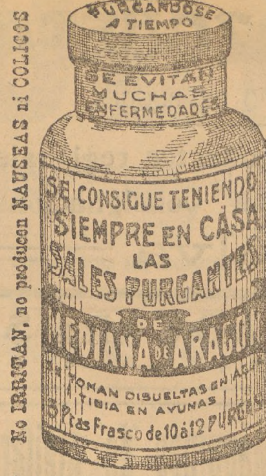
LEA V. “DIARIO DE HUELVA”.

Gratis para los pobres de 4 a 5 de la tarde.