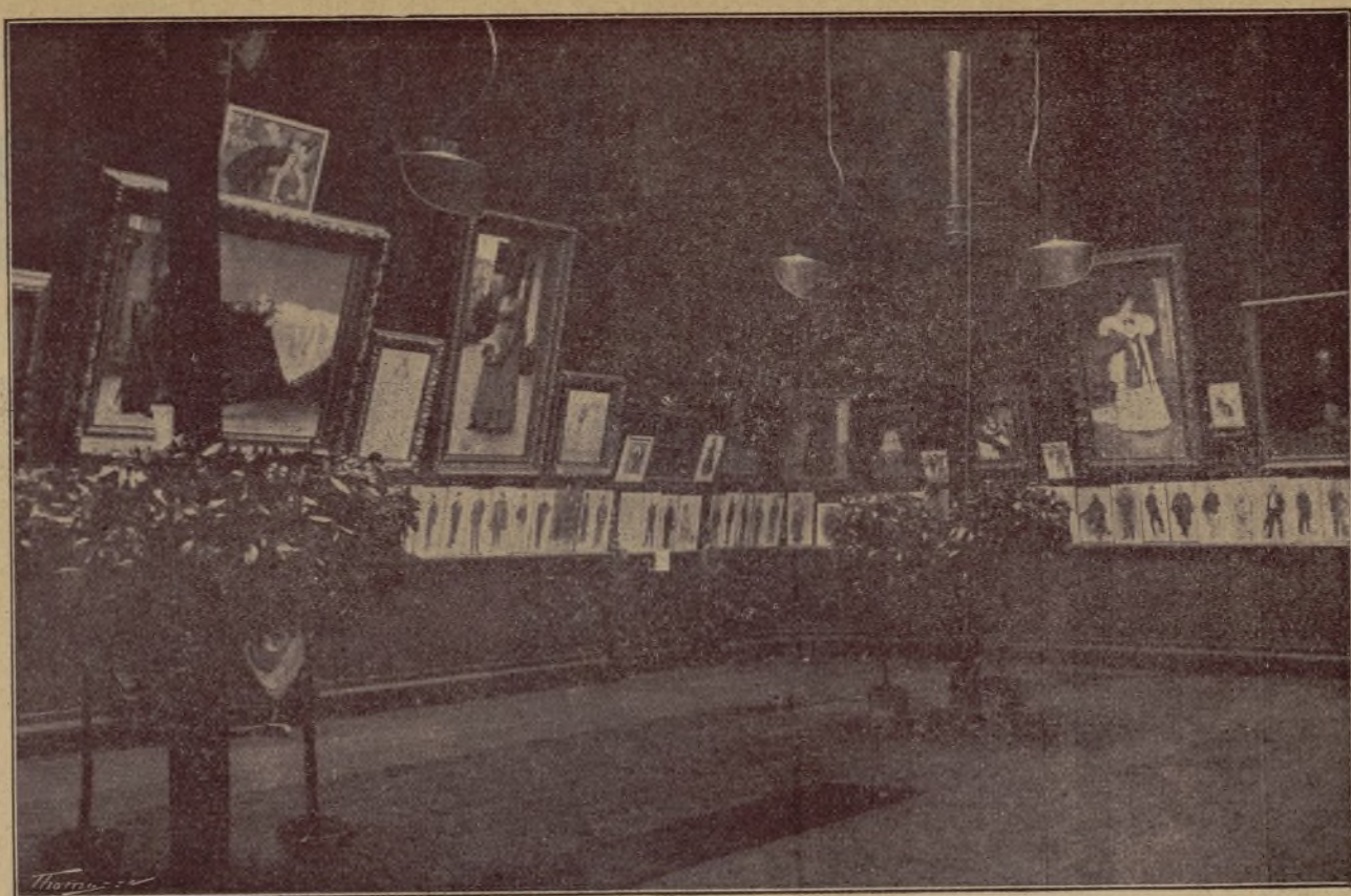
SALÓ PARÉS. — Costat dret