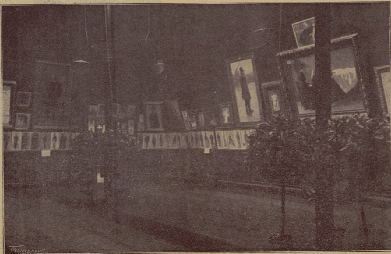
SALÓ PARÉS.—Costat esquerre

A Can Parés continuen venent-se proves d'artista, enquadrades, numerades, firmades i retocades a mà, al preu de 10 pessetes l'exemplar sol i 75 pessetes la col·lecció de deu