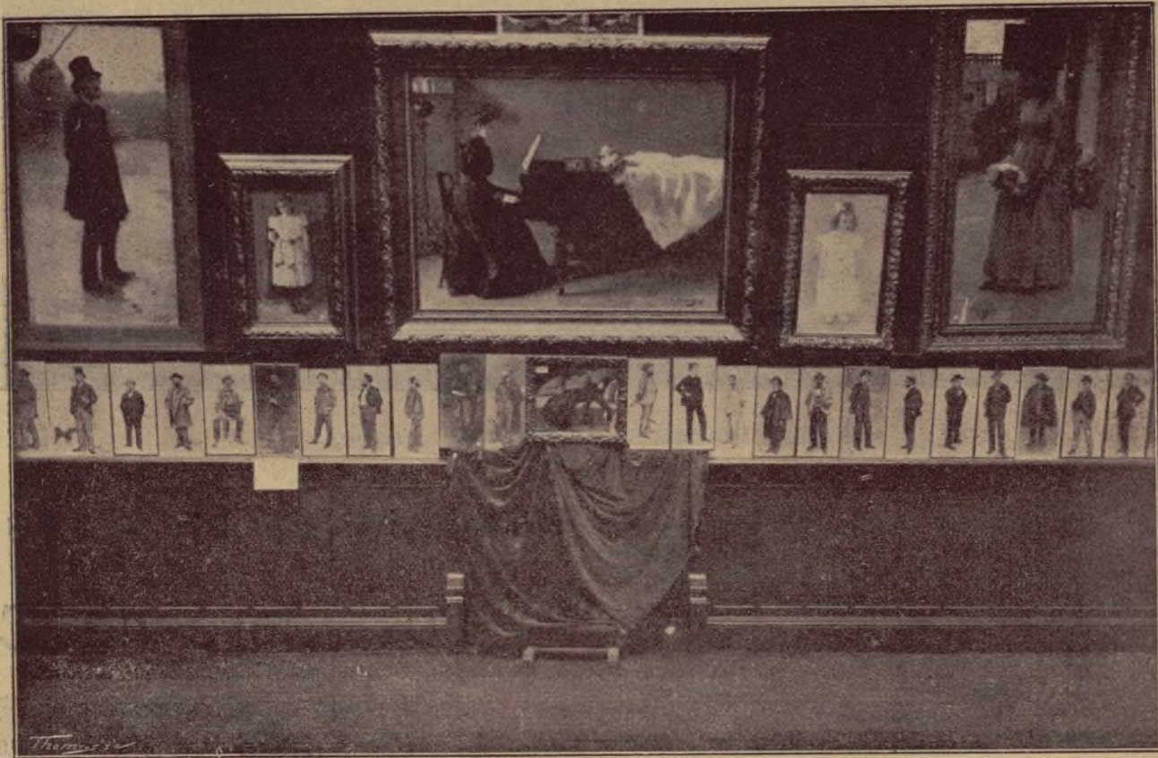
SALÓ PARÉS.—Part central

A Can Parés continuen venent-se proves d'artista enquadrades, numerades, firmades i retocades a mà, al preu de 10 pessetes l'exemplar sol i 75 pessetes la col·lecció de deu