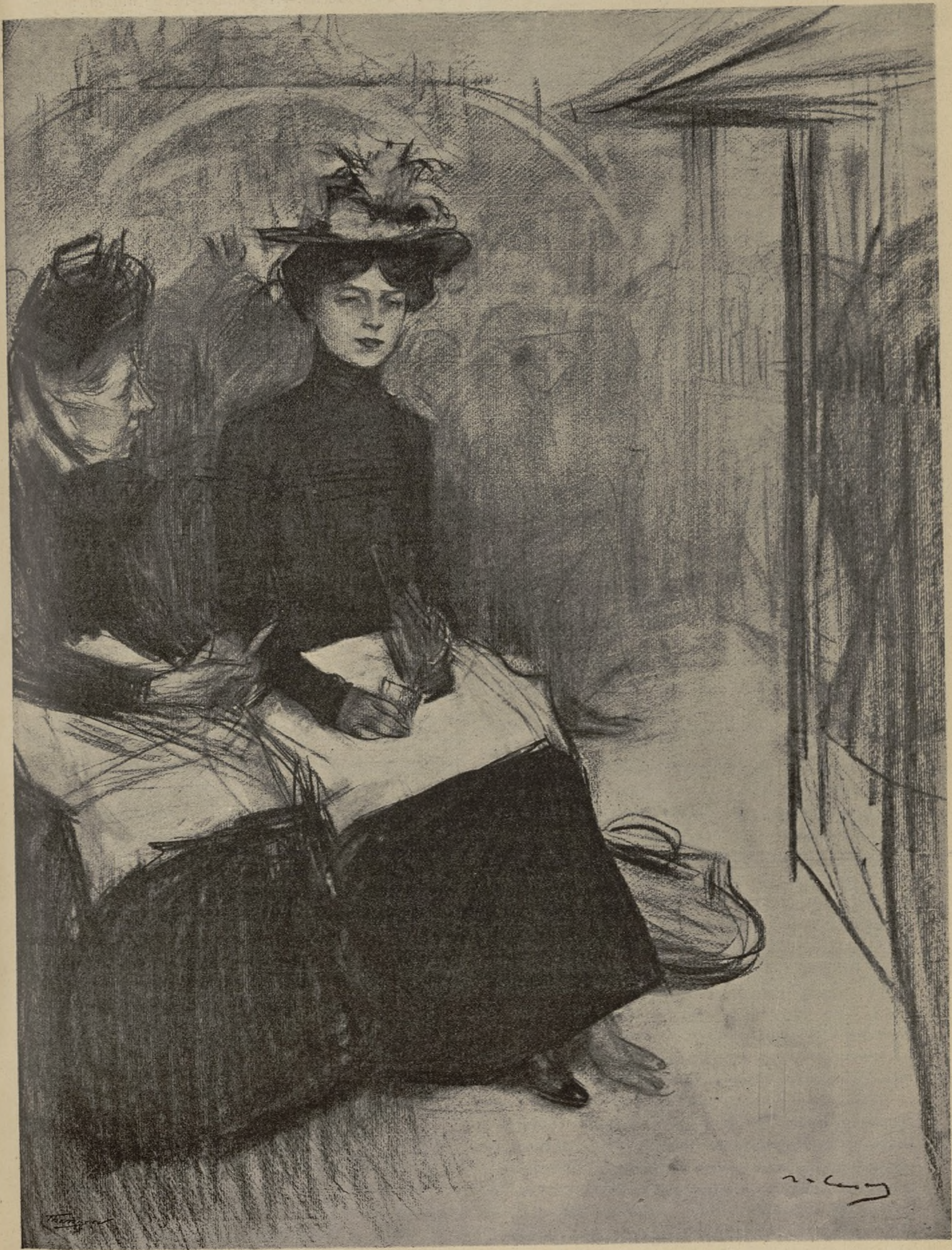
RESTAURANT BARATO, per R. CASAS