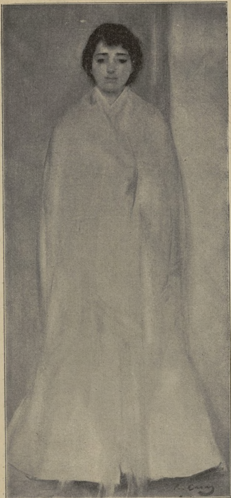
ESTUDI PER R. CASAS