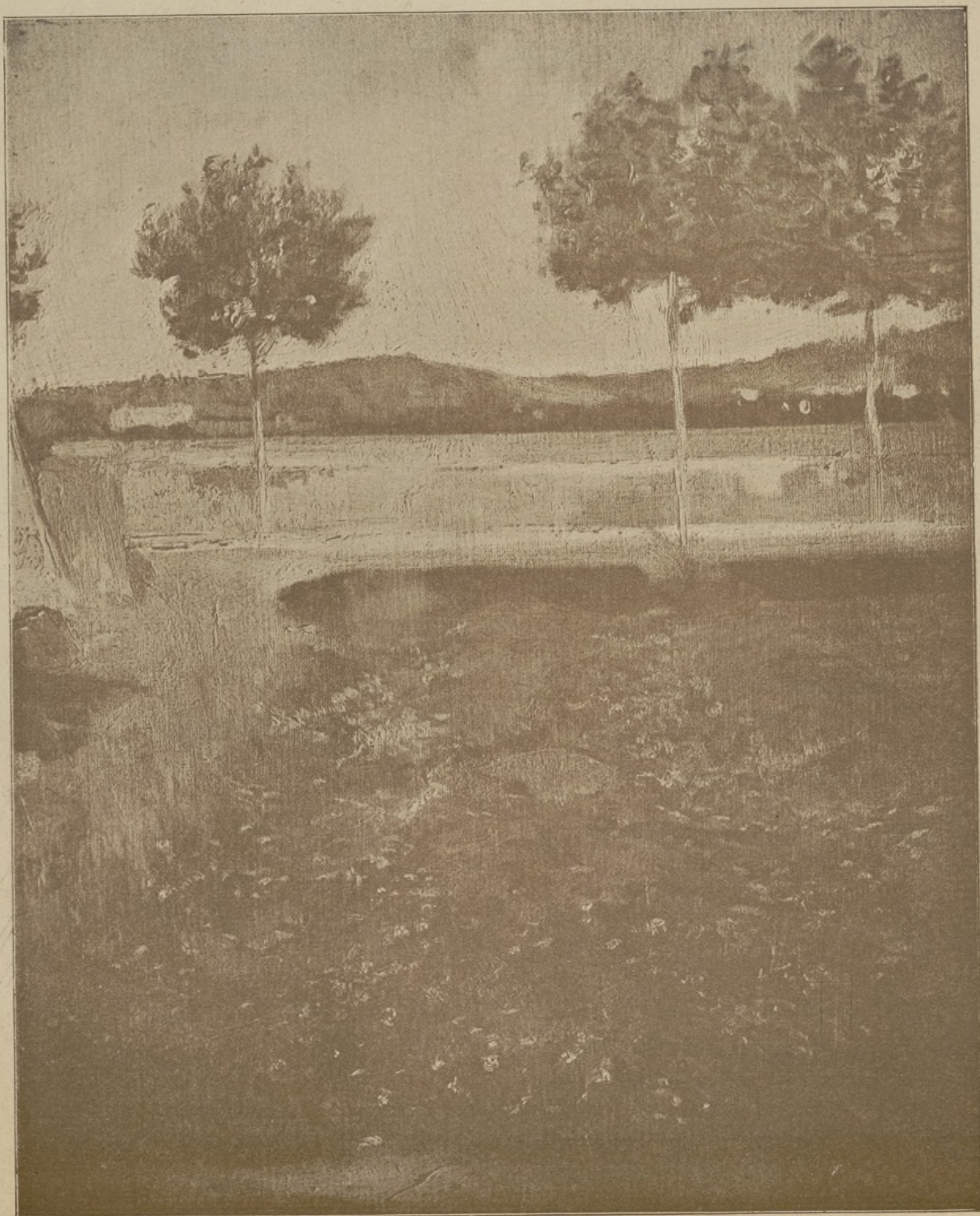
PAISATJE DE TARDOR, per R. CASAS