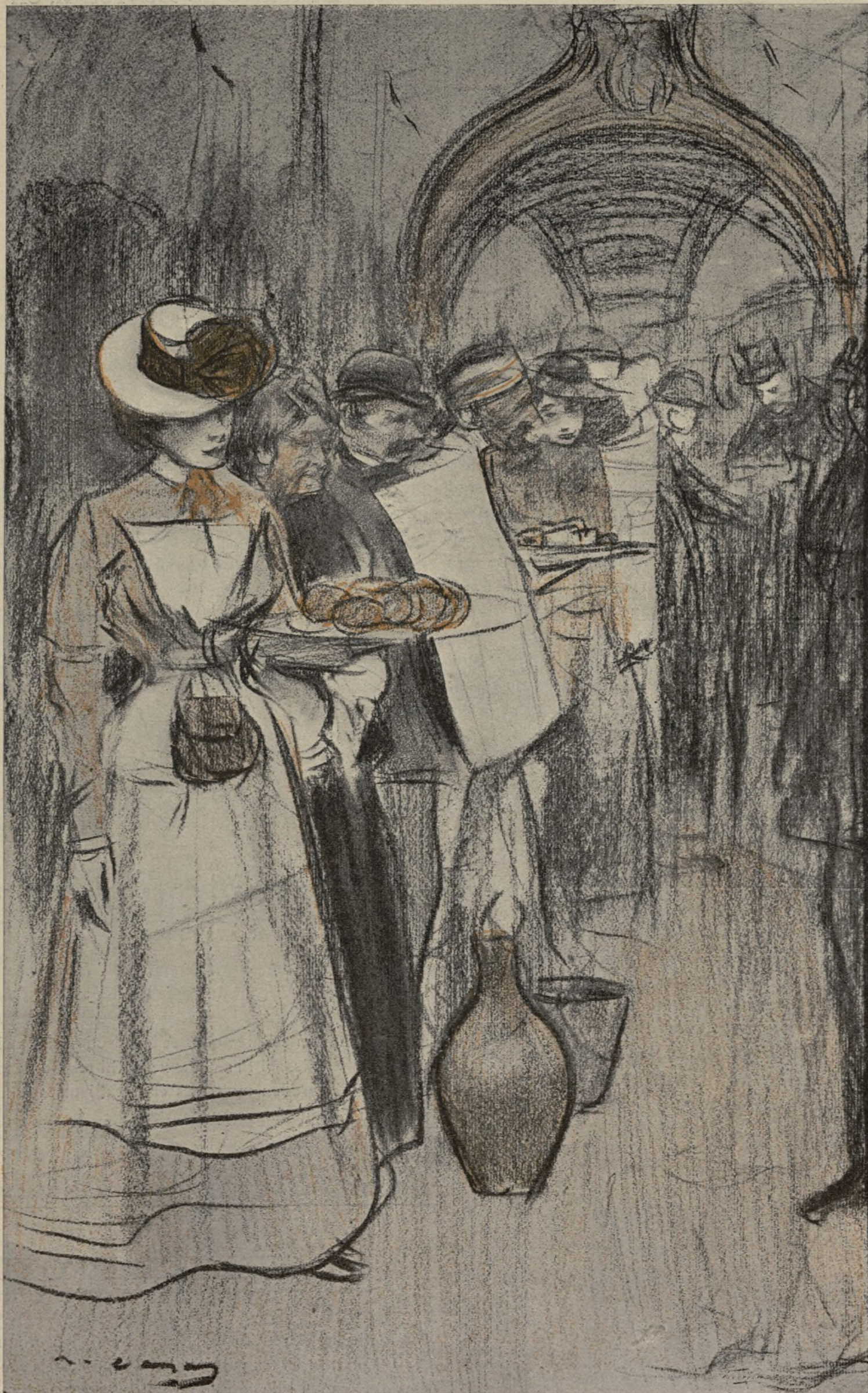
MENJAR BARATO (EXPOSICIÓ), per R. CASAS