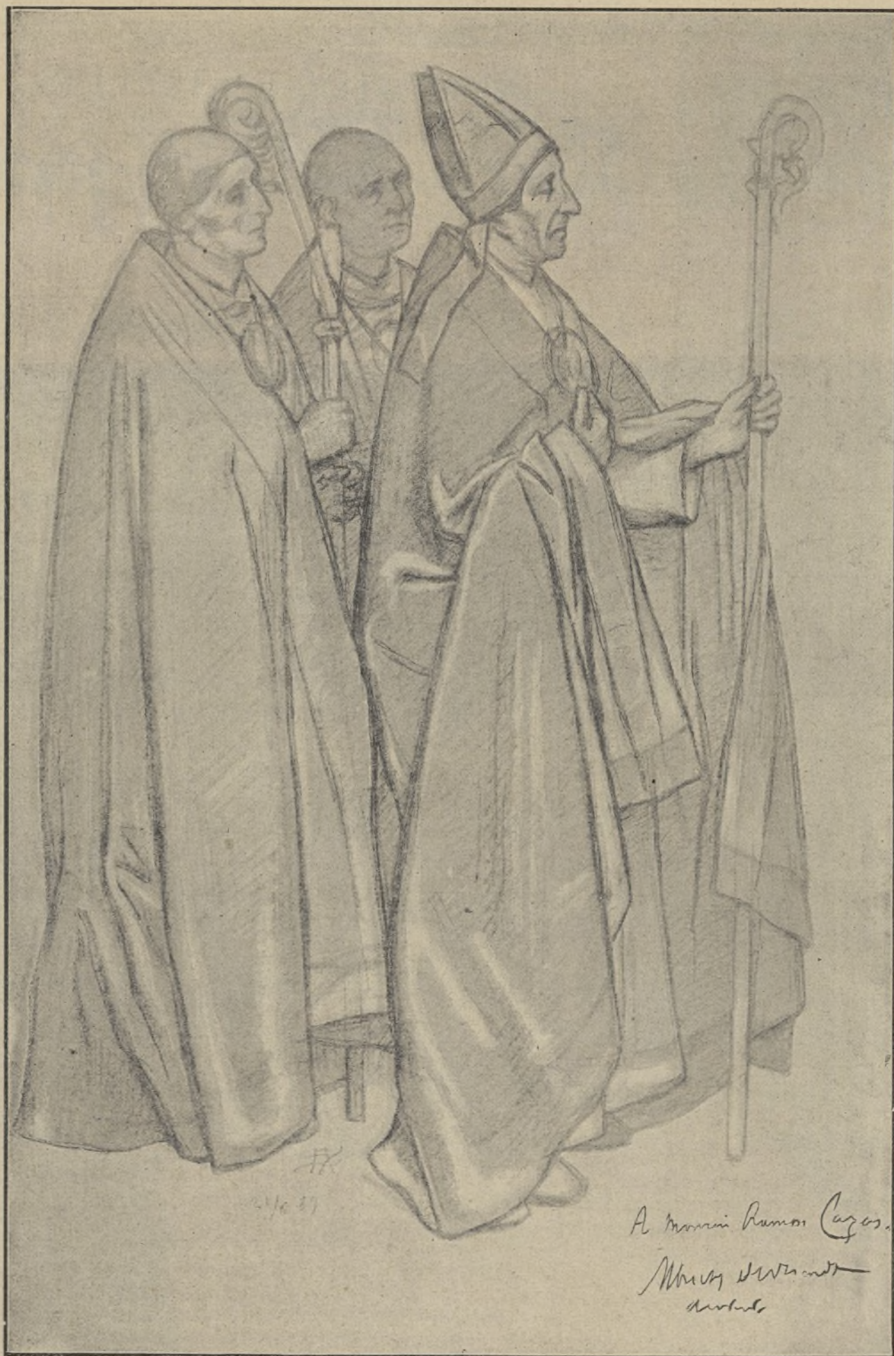
ESTUDI, per A. DE VRIENDT