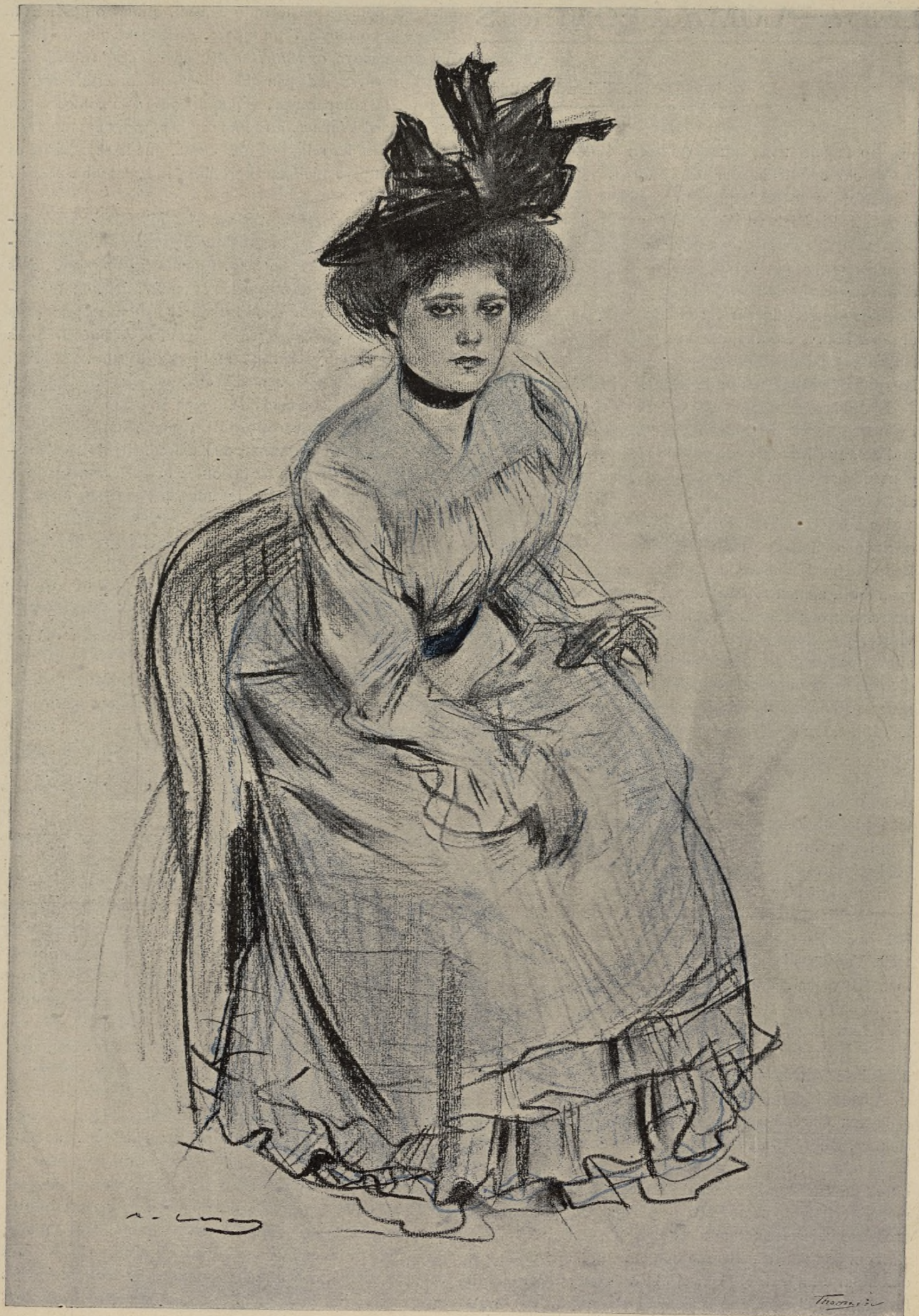
LA MODELA, per R. CASAS