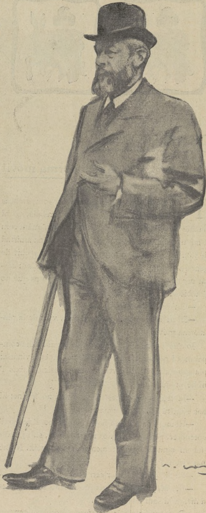
Albrecht de Vriendt

Además de la seva situació artística, l' Albrecht de Vriendt fou un dels caps de colla quant s' iniciaren á Bélgica les reivindicacions de les Flandes i Brabant, i les lluites polítiques entre flamingants i fransquillons . Al obtenirse l' igualtat oficial entre les llengües flamenca i francesa i l' acunyació de les primeres monedes amb inscripció fla-