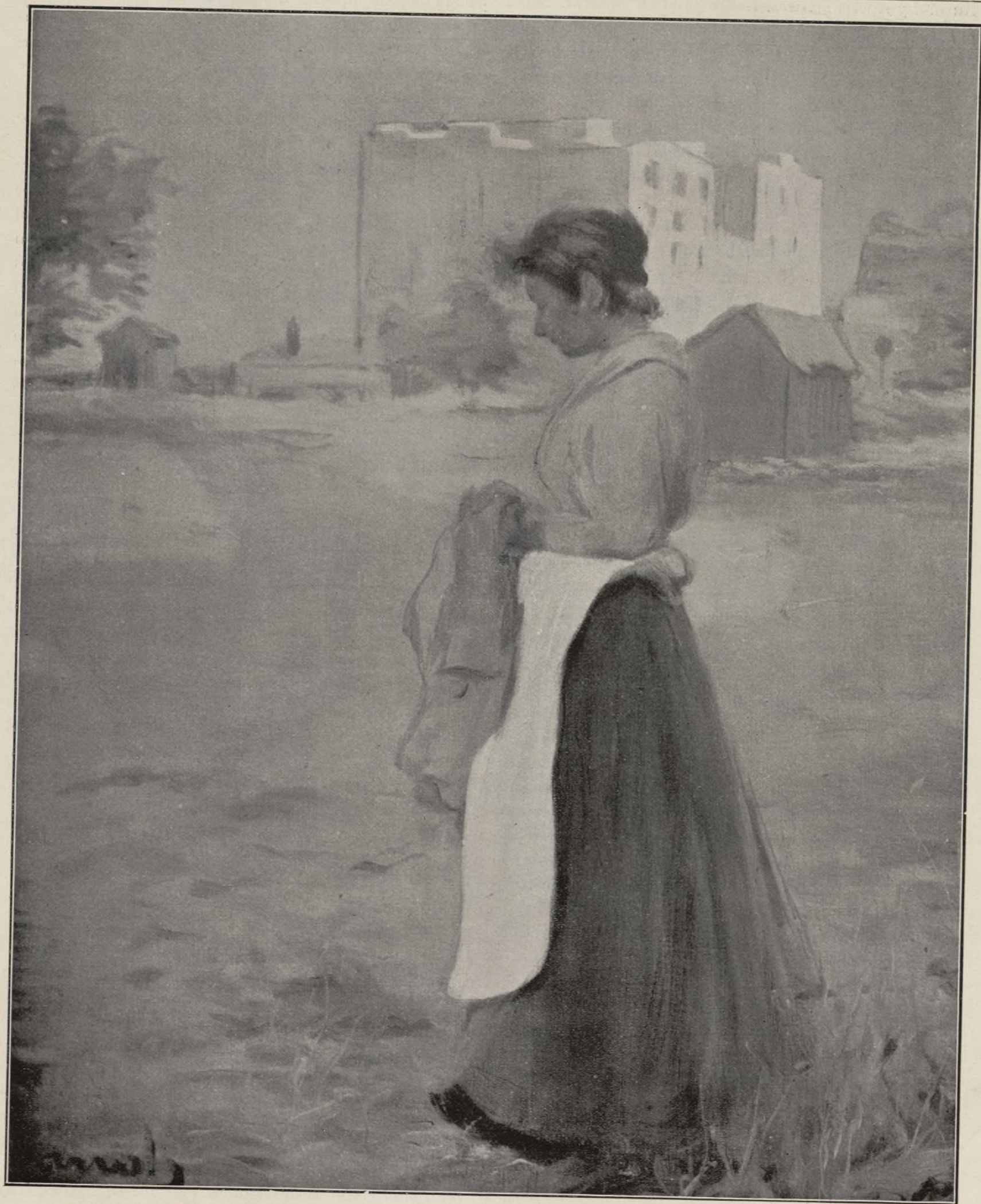
SUBURBIS DE BARCELONA.