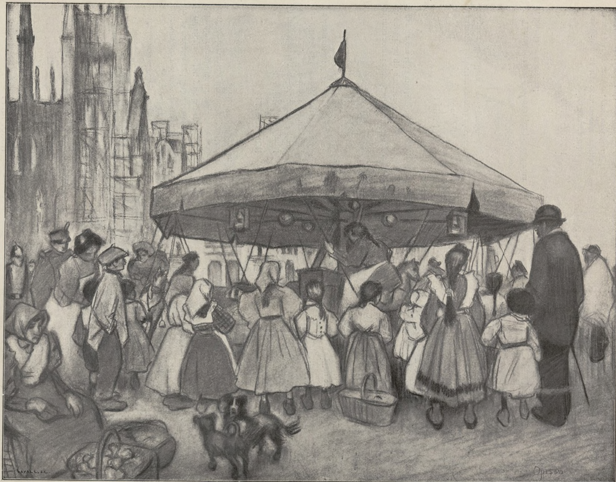
CABALLITOS BARATOS. Dibuix d' OPISSO.