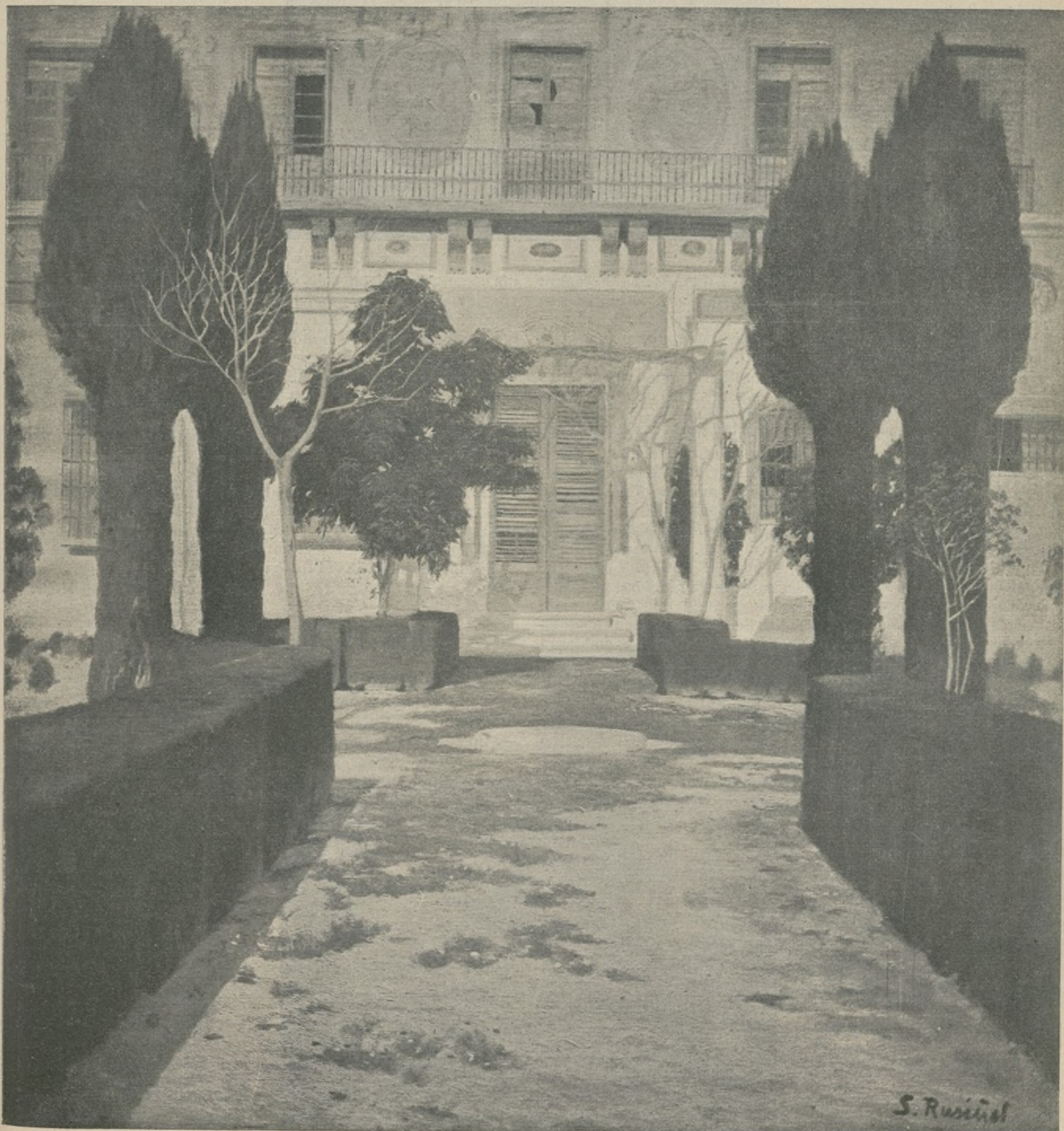
Quadro den SANTIAGO RUSIÑOL ( Jardins d'Espagne )