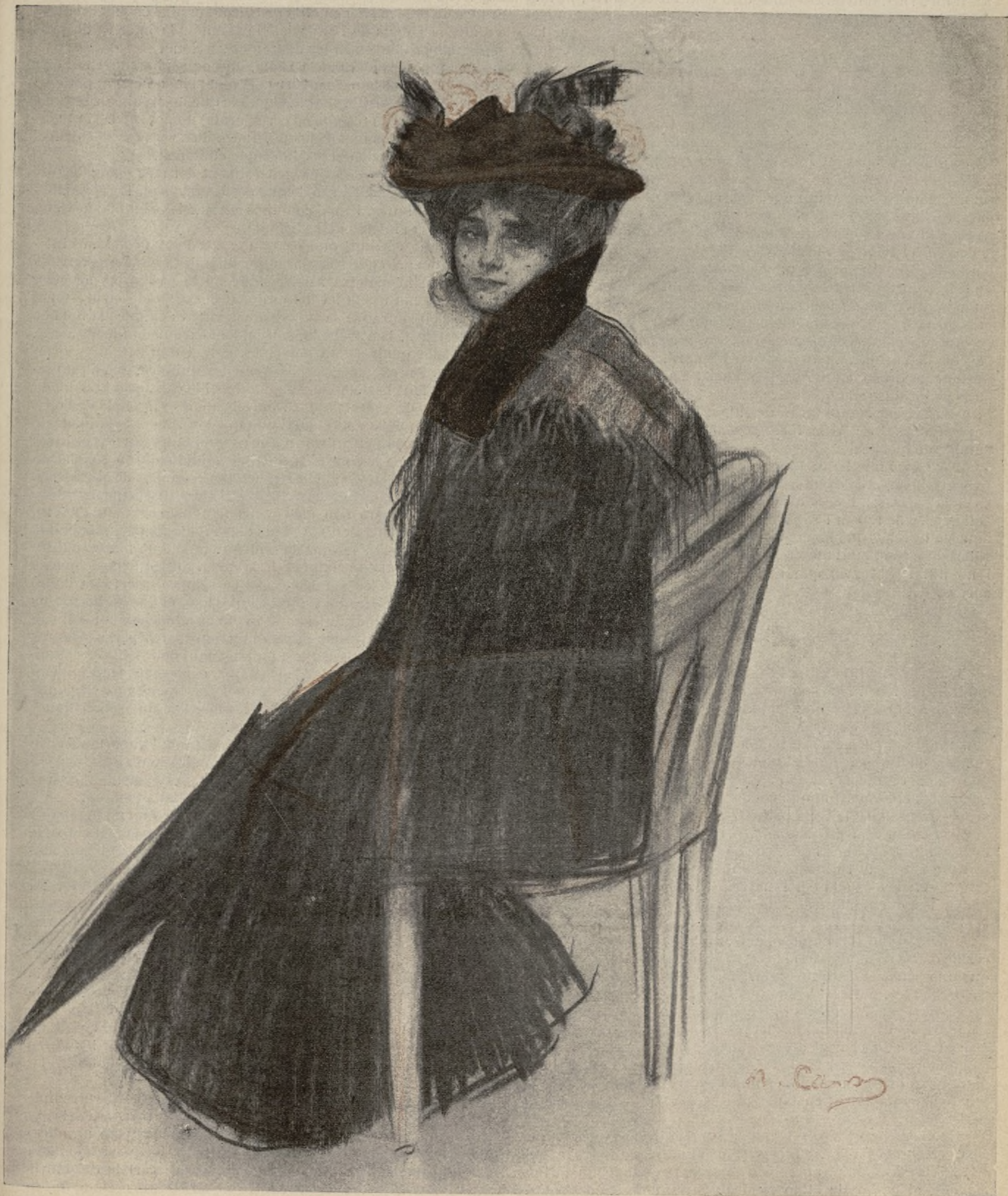
Dibuix del natural, per R. CASAS