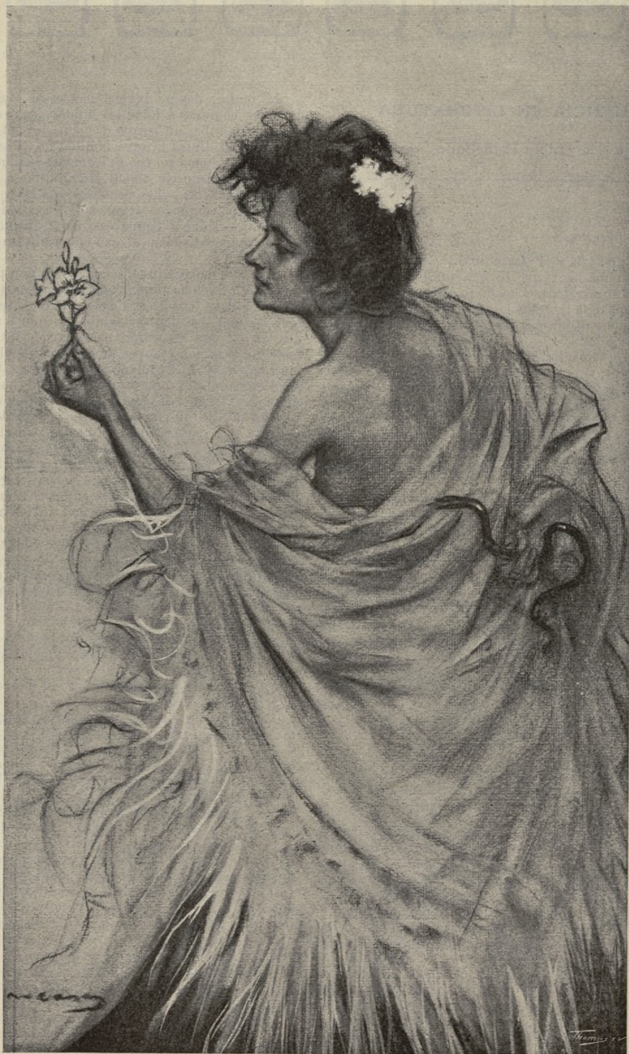
Dibuix pera 'l cartell del SANATORI DEL DR. ABREU, per R. CASAS