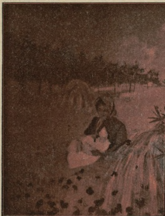
L'ISTIU, fragment de la decoració del menjador de Càn Casas

Las promesas d' Abril van acomplintse sota l'ardencia paternal del sol: