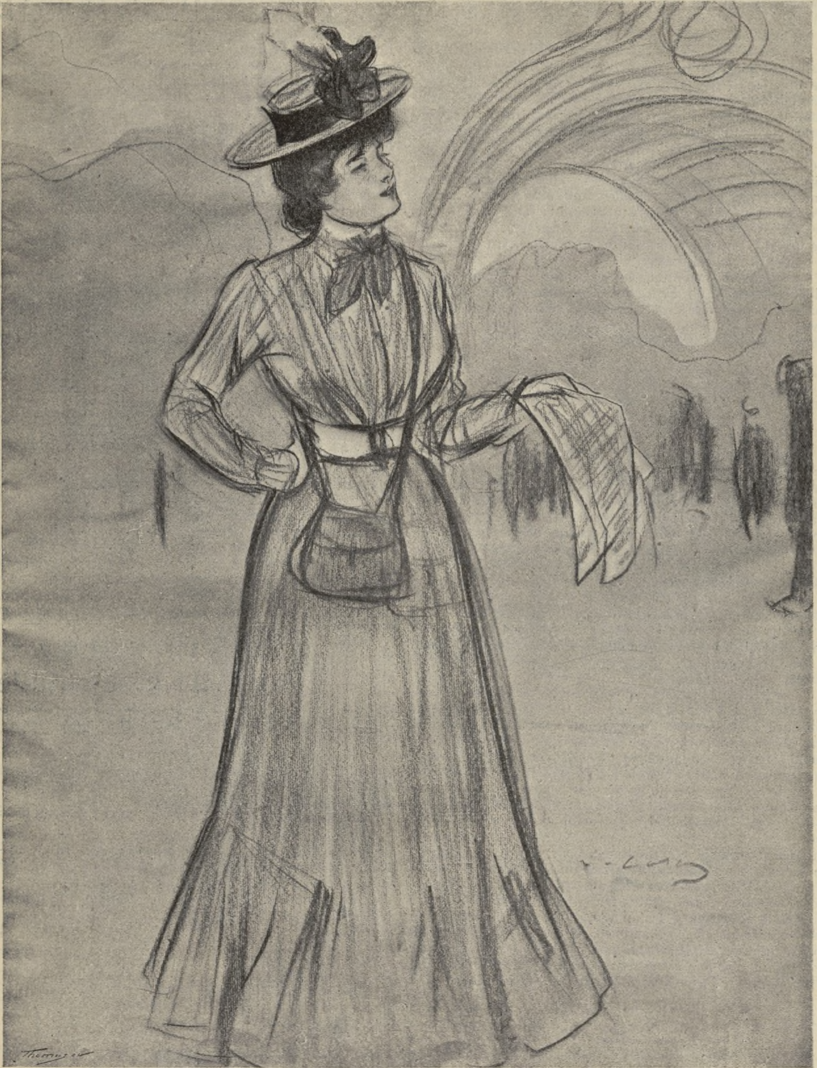
REVENEDORA DE TICKETS