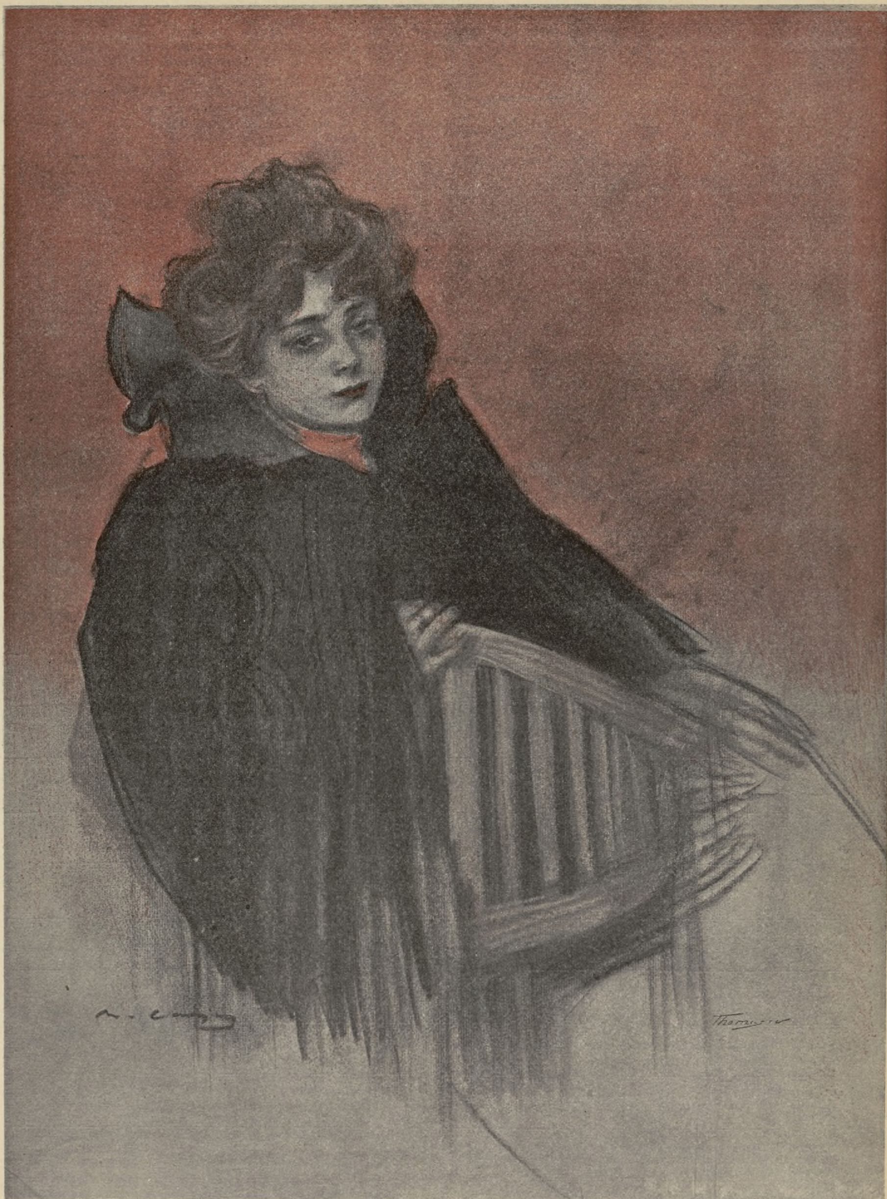
MOLINERA DE LA GALETTE