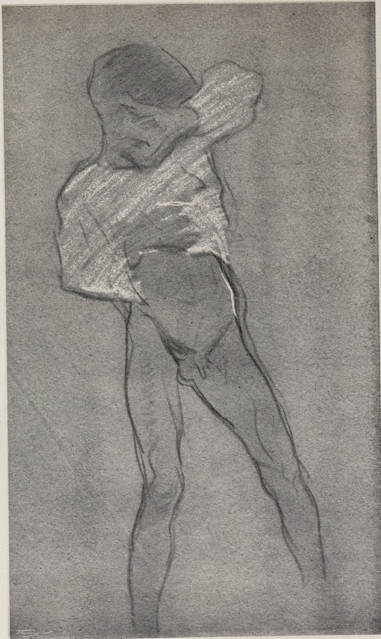
Dibuix de J. SOROLLA