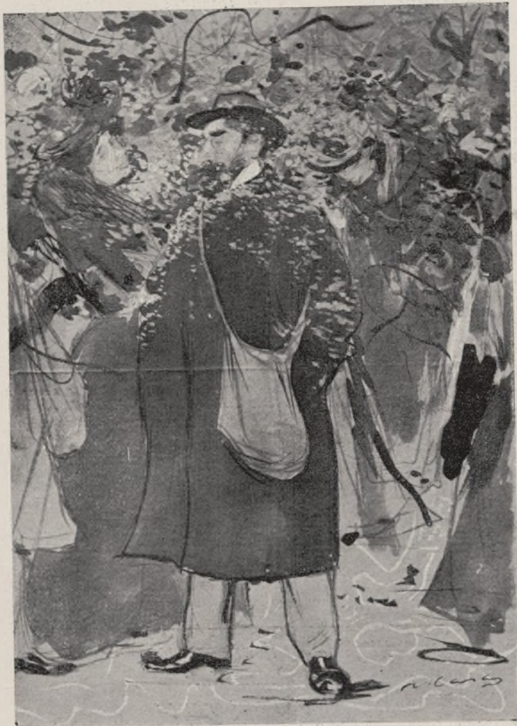
RECORT DE LA MI-CAREME