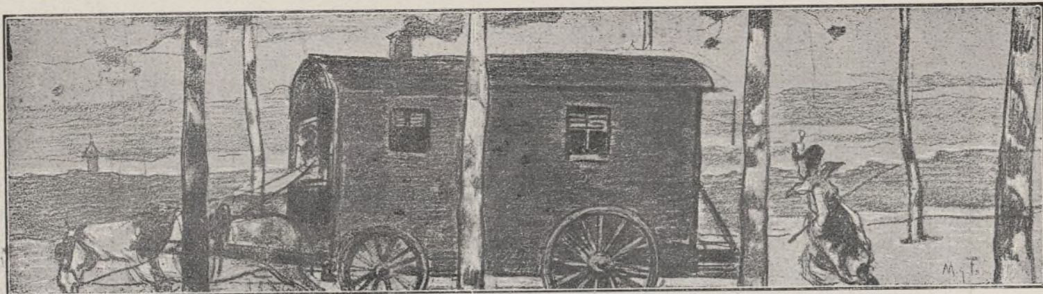
Dibuix de A. MAS Y FONTDEVILA