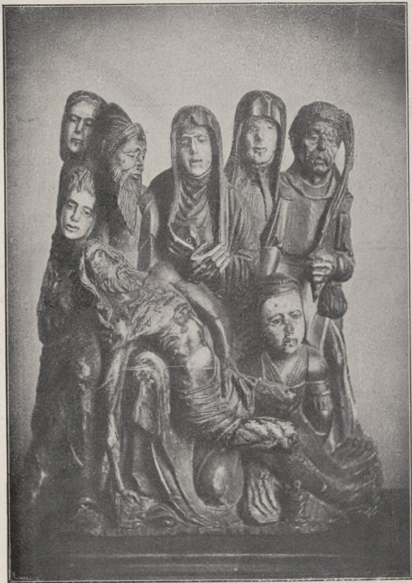
Escultura antiga espanyola, d'autor desconegut

la vida sencera; per ell, el teatre es el mon i d'ell ne surt tot i á n'ell pot anarhi tot; per aixó ha aprofitat la seva estada á Barcelona pera estudiar lo que 's fa de teatre i no podent apendrer á representar, ha fet el qu' ha pogut pera endursen cap á la seva terra les obres que millor poden ser compreses en altres terres que no tenen les nostres costums.