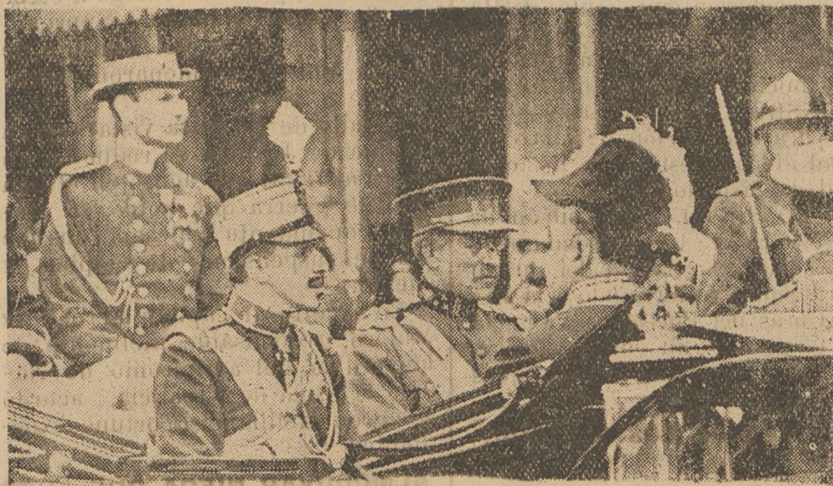
Los Reyes don Alfonso y don Alberto al salir de la estación de Bruselas