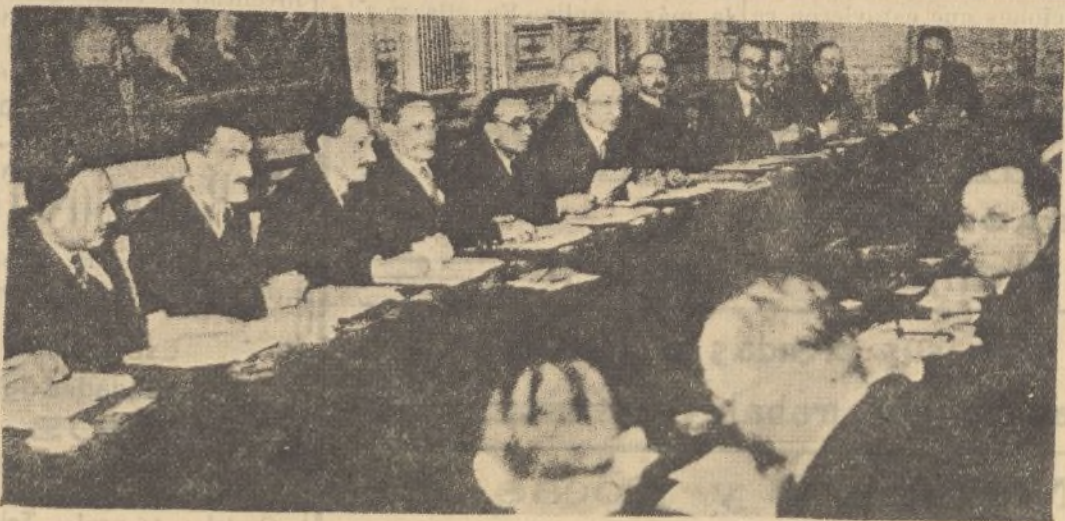
El primer Consejo celebrado por el nuevo Gobierno francés bajo la presidencia de León Lum.

Plaza de las Monjas, 3 - Apartado, 125 - Teléfono 1520