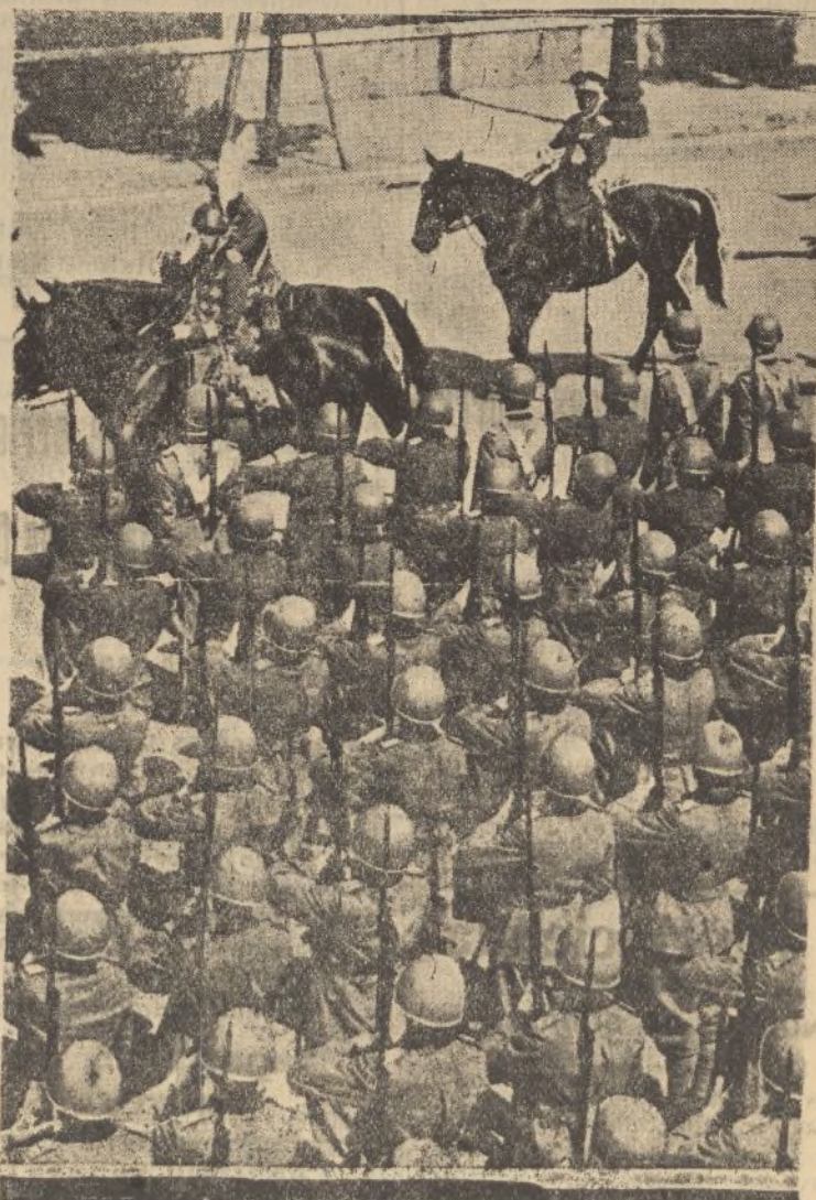
Italia ha festejado su día con solemnidades. Entre los festejos figuró una revista de los 20.000 soldados de la guarnición. La foto recoge el momento en que las tropas presentan armas al rey Víctor Manuel y al virrey de Etiopía, mariscal Badoglio.