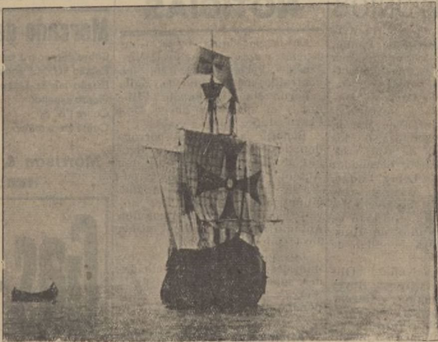
La carabela «Santa María», anclada en la Punta del Cebo. —Vista a lo largo, parece cruzar los mares, llevando ya a bordo a los muchachos de Huelva que pretenden rememorar, reproduciendo, el viaje descubridor.

Poco antes de escribir estas líneas precisamente ya habia-