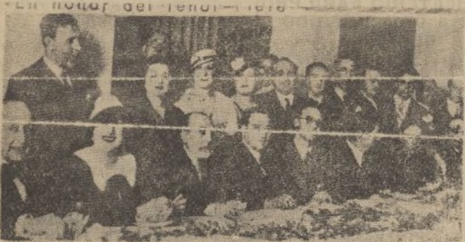
Vino de honor ofrecido por la Peña Fleta, de Madrid, al insigne tenor, por su nombramiento de catedrático del Conservatorio Nacional.