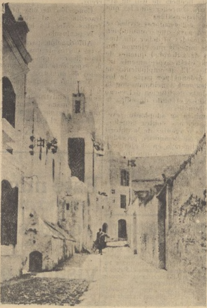
TETUAN.—Barrio moro. Aspecto y Mezquita de la calle de Sidi Sali