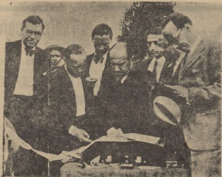
En una finca de Medinaceli, en Espeluy, se ha colocado por los ingenieros de la Reforma Agraria la primera piedra de un pueblo de nueva fundación, que se llamará Arjonilla la Nueva.