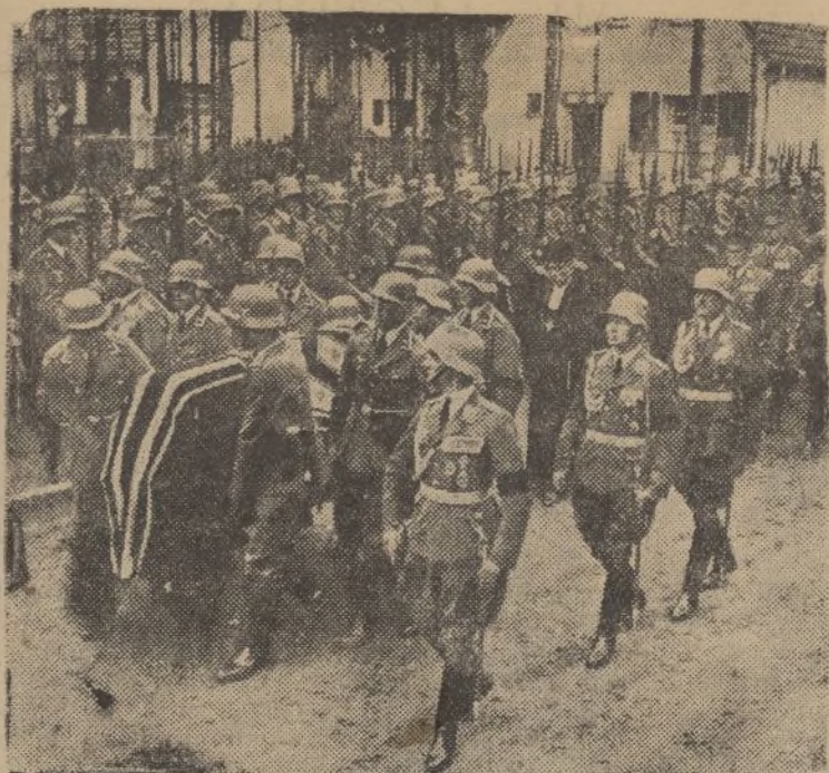
El general Goering preside el entierro del jefe de las fuerzas aéreas alemanas, general Wever, que murió recientemente en un accidente de aviación.