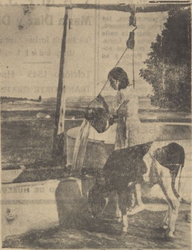
Una vista del magnífico cuadro de Brunt, titulado «La gitana y la becerra» que hoy figura en la Exposición Nacional

Dichos vales eran canjeables por artículos de primera necesidad, en diversas tiendas de Madrid.