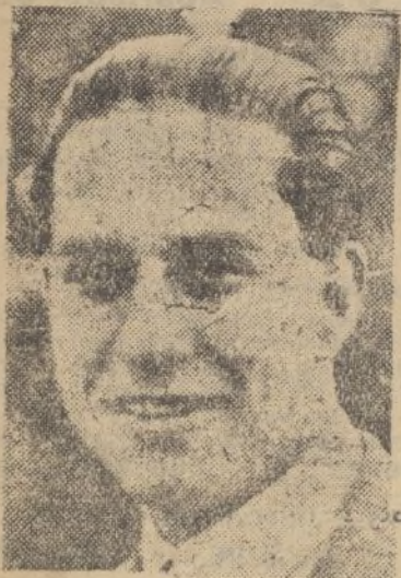
ROMA.—El Conde Galeazzo Ciano, nuevo ministro de Negocios Extranjeros

En el puesto de gobernador del Banco de Francia, que ocupaba el señor Tannery, ha sido nombrado el antiguo procurador general del Tribunal de Cuentas señor Labeyrie.