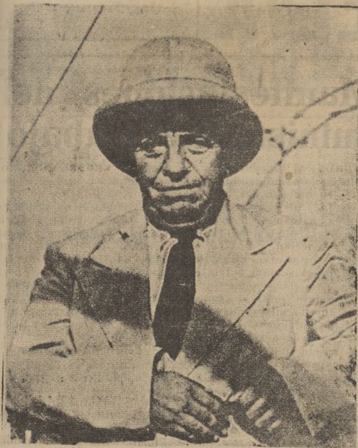
El general turco Wehib Pachá, que mandaba las fuerzas abisinias contra los italianos, al llegar a Grecia, donde piensa descansar algún rato.