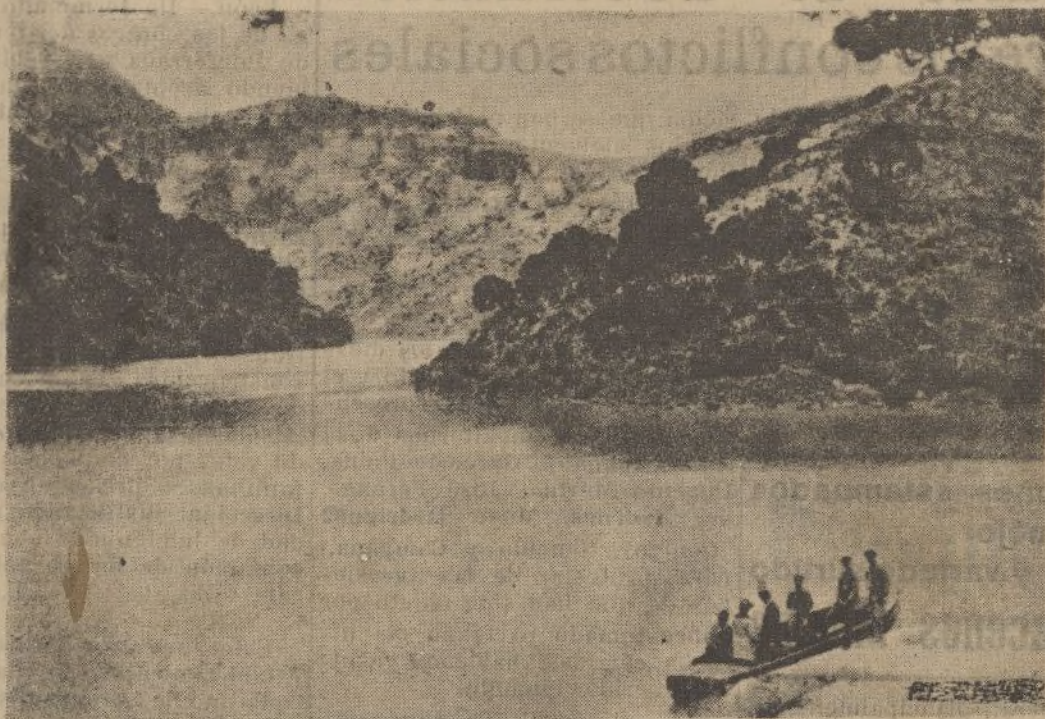
MÁLAGA: EL CHORRO