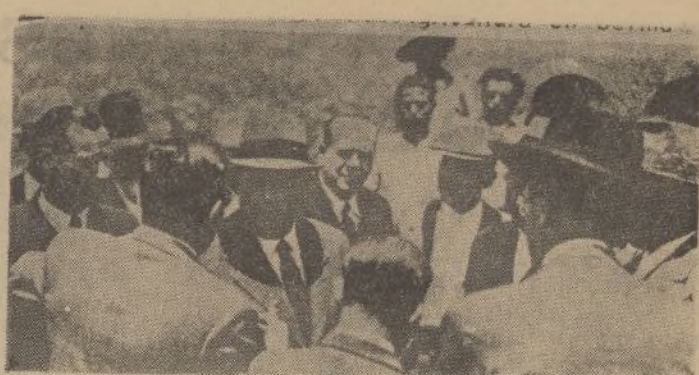
SEVILLA.—El ministro de Agricultura, señor Ruiz Funes, conversando con los obreros asentados en una finca del término de Guillena