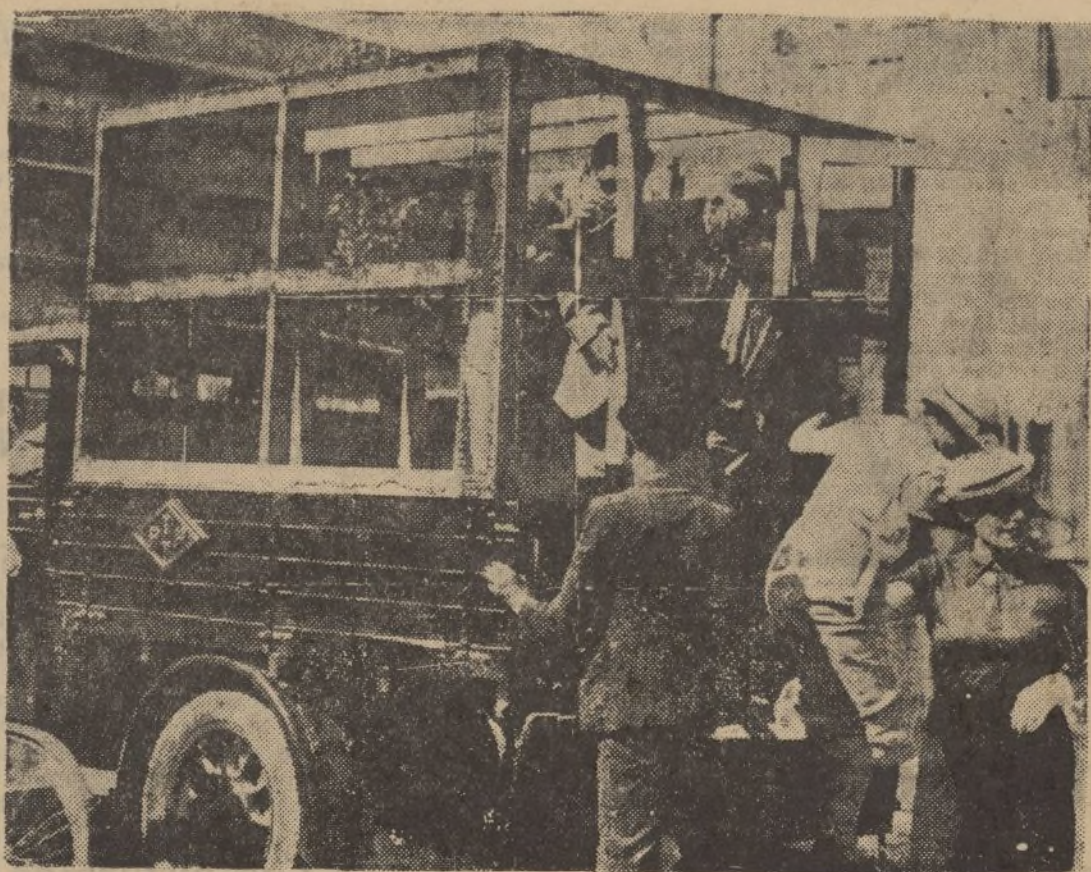
No se consigue restablecer la paz en Palestina. La foto reproduce una camioneta de viajeros que van protegidos por la red de alambre contra los proyectiles ofensivos...

Terminó diciéndonos el gobernador que el orden público estaba garantizado reinando tranquilidad tanto en Huelva como en los pueblos de la provincia.