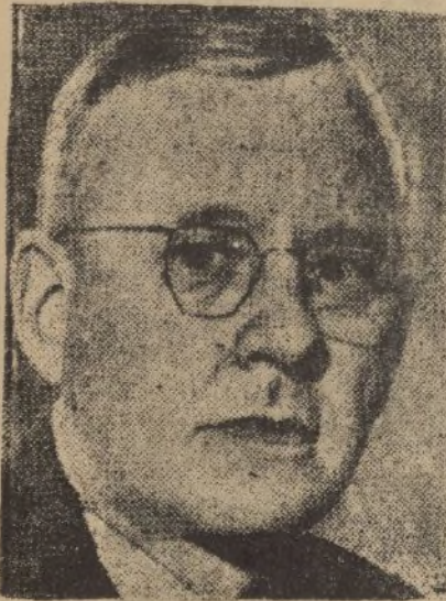
El gobernador Landon, candidato a la presidencia de los Estados Unidos.