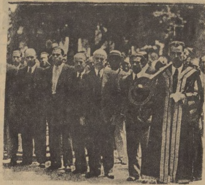
Presidencia del duelo en el entierro del presidente de la Excm. Diputación de Málaga.