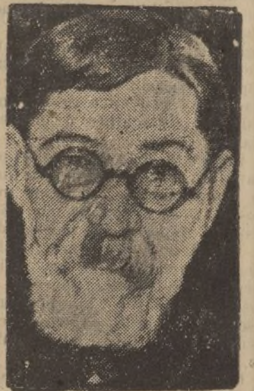
Hoy entra en la Academia Francesa otro inmortal: Louis Gillet, ensayista e historiador.