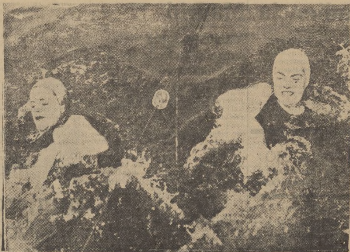
Dos nadadoras olímpicas americanas, Eleanor Holm-Jarret, a la izquierda, y Elizabet Compa, durante una prueba de 200 yardas, en la que resultó vencedora la primera.