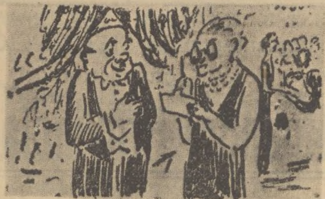
—¡Cielos!, el vizconde que no puede venir. ¡Vamos a ser trece a la mesa! —Dieciséis, marquesa. Yo como por cuatro.

Fueron nuestras palabras de ánimo para nuestros valientes paisanos, reiterándole el ofrecimiento de las columnas de nuestro periódico a su favor.