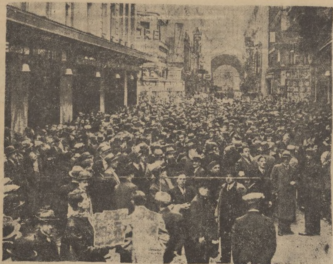
La huelga de los obreros franceses llegó a los grandes almacenes de París. Un aspecto de la calle de Rivoli, en los alrededores de uno de estos grandes establecimientos. Los dependientes comentan el desarrollo del conflicto.