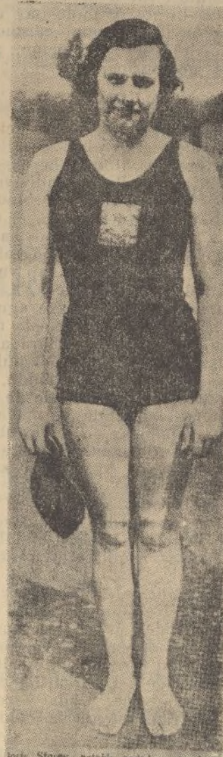
Miss Doris Storey, notable nadadora, proclamada en Londres como la atleta más completa de Inglaterra