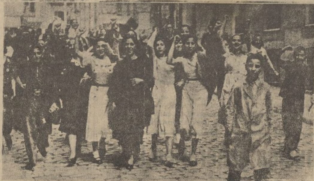
MADRID.—Un grupo de modistillas, en huelga por el conflicto del gremio de sastrería, recorre las calles de la capital