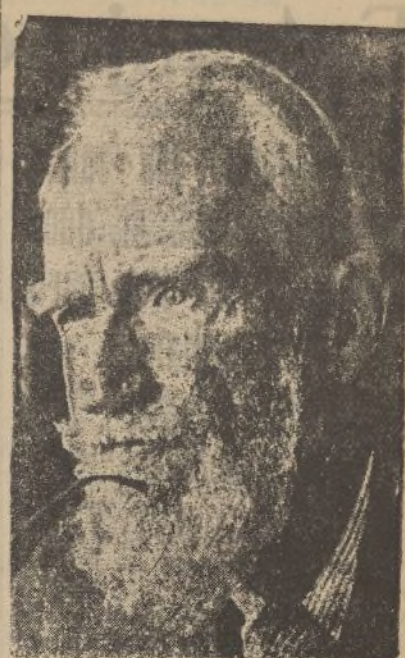
Bernard Shaw había anunciado, que no daría más charlas públicas, y ha vuelto a aparecer en un escenario de un teatro de Newcastle. El mes que viene cumple el viejo humorista ochenta años.