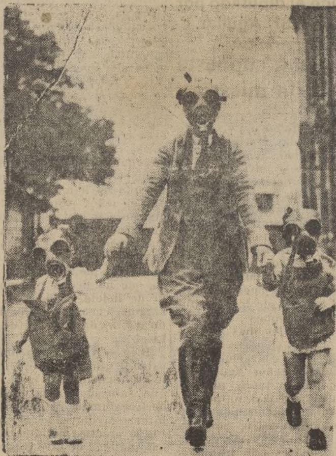
Una mamá inglesa con sus dos niños, a los que lleva al colegio provistos todos con caretas contra los gases asfixiantes, en práctica por sí en el porvenir tuvieran que defenderse contra los mismos.