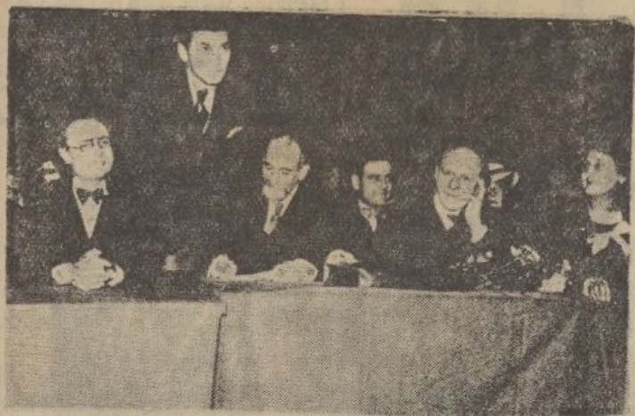
En el estadio de Búfalo, de París, se ha celebrado una reunión pro paz, a la que concurrieron más de veinte mil personas. En la tribuna oficial, aparecen, entre otras personalidades, el ministro del Aire francés y lord Rober Cecil