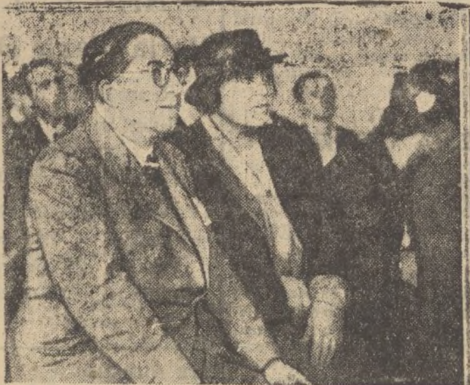
El matrimonio Ortega y Gasset contempla desde los asientos destinados al público las incidencias del juicio oral contra los acusados por el atentado de que fué objeto