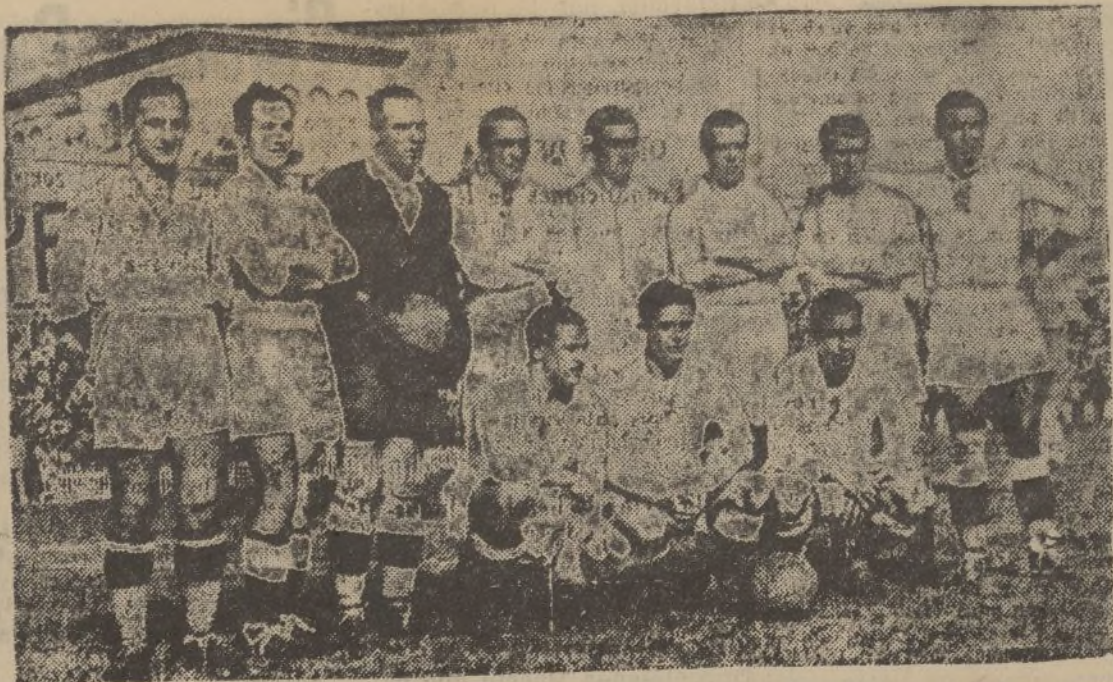
El «Madrid F. C.» que después de una magnífica exhibición de juego, logró vencer a su rival el «F. C. Barcelona» y adjudicarse el título de Campeón de España