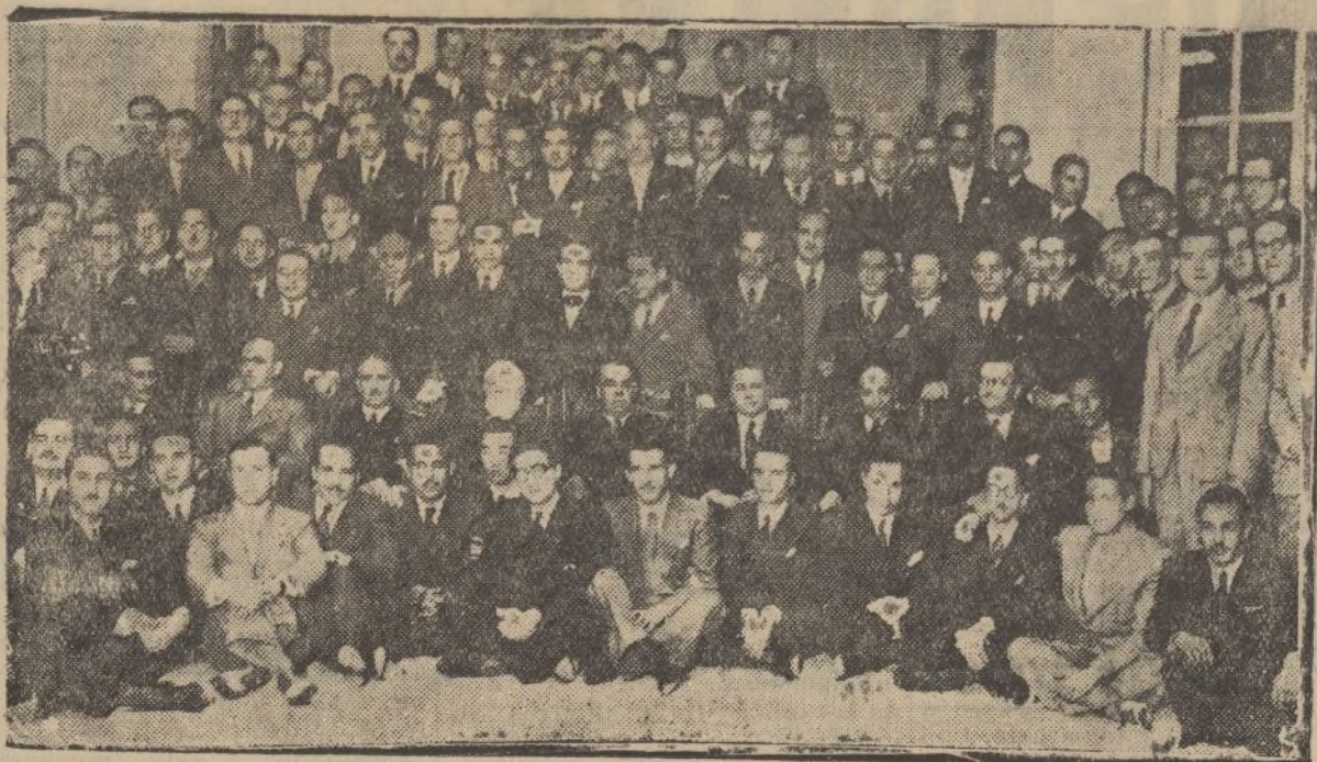
Con la asistencia del ministro y el subsecretario de Justicia y los miembros del Tribunal examinador se reunieron en un banquete, celebrado en Madrid, los aspirantes a la Judicatura de 1936.