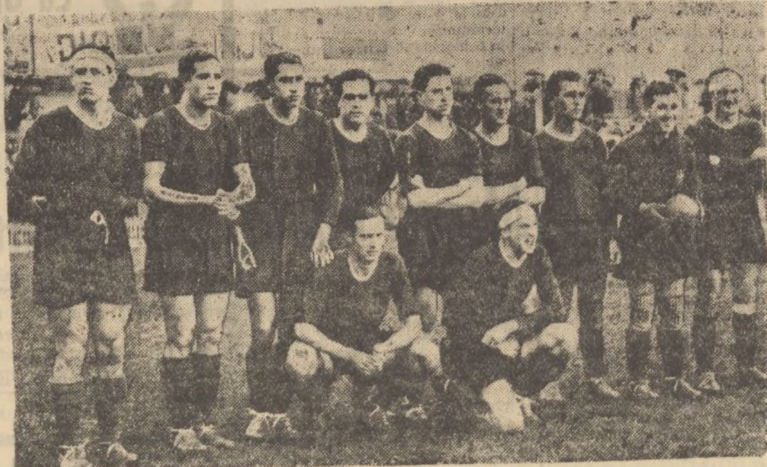
El F. C. Barcelona que en franca y noble lucha con el «Madrid F. C.» para la consecución del título de campeón de España, perdió por dos tantos a uno