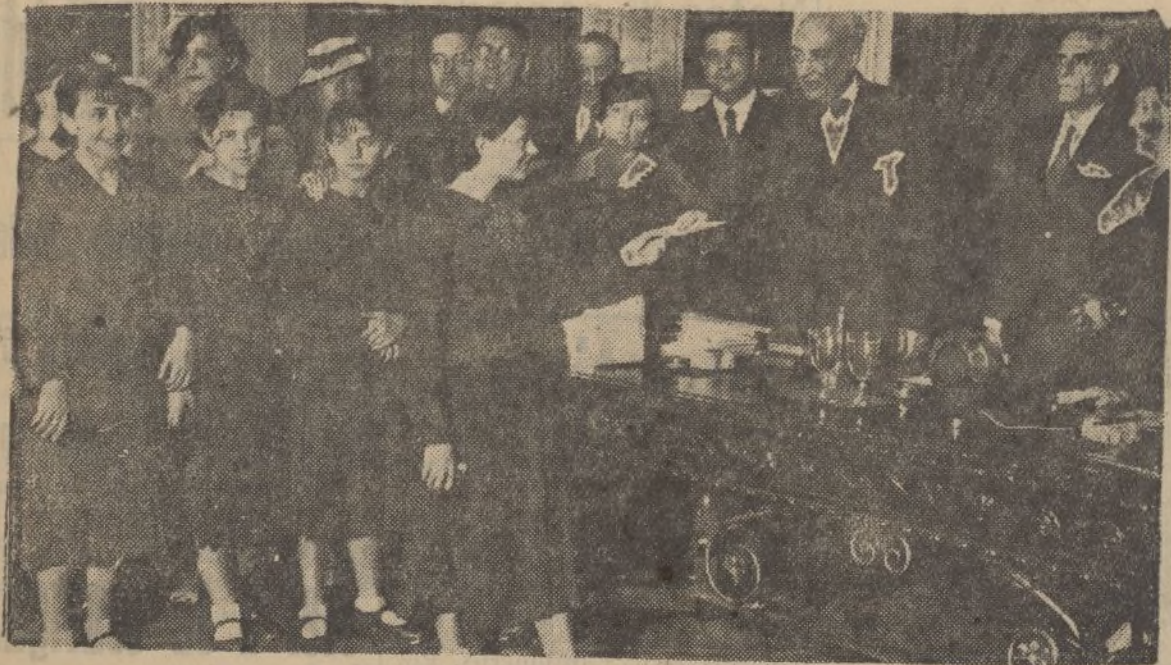
El ilustre cirujano, doctor Gómez Ulla, reparte cincuenta cartillas a otros tantos niños huérfanos de los Colegios Médicos de España, a los que ha dedicado el homenaje que sus enfermos le tributan.