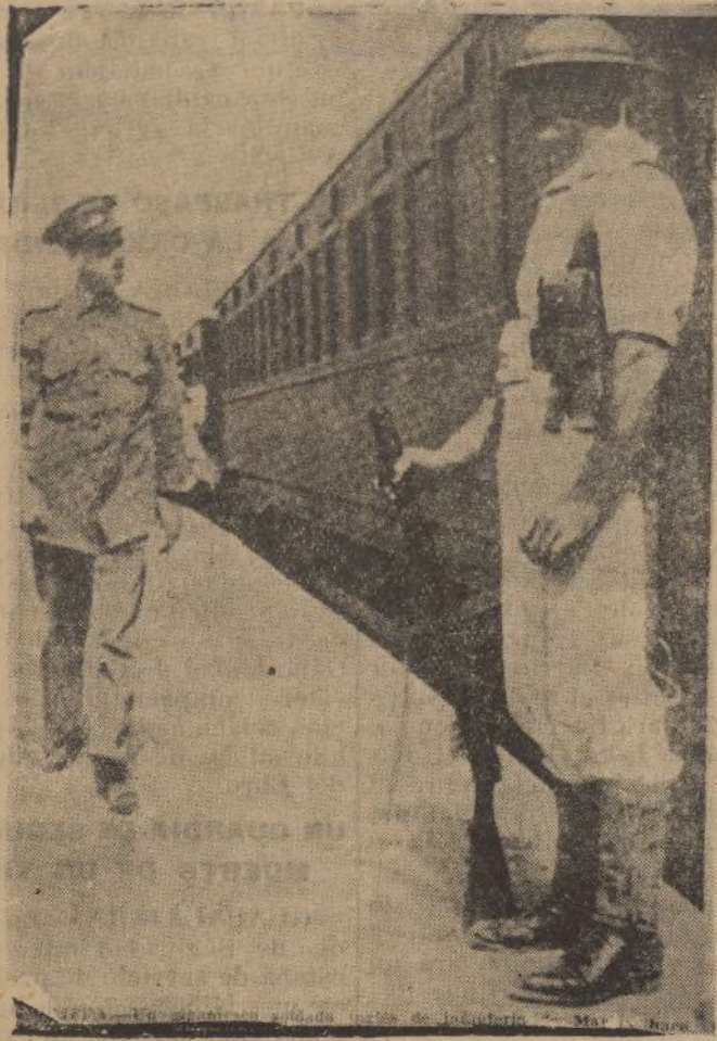
Soldados ingleses custodiando los trenes