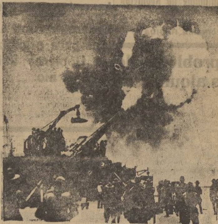
Estos cañones de 14 pulgadas, del Ejército americano, han permanecido en silencio durante ocho años. Al cabo de este tiempo se han puesto a prueba nuevamente. Los disparos se hacen muy lejos de San Diego de California, para evitar la rotura de los cristales de la ciudad