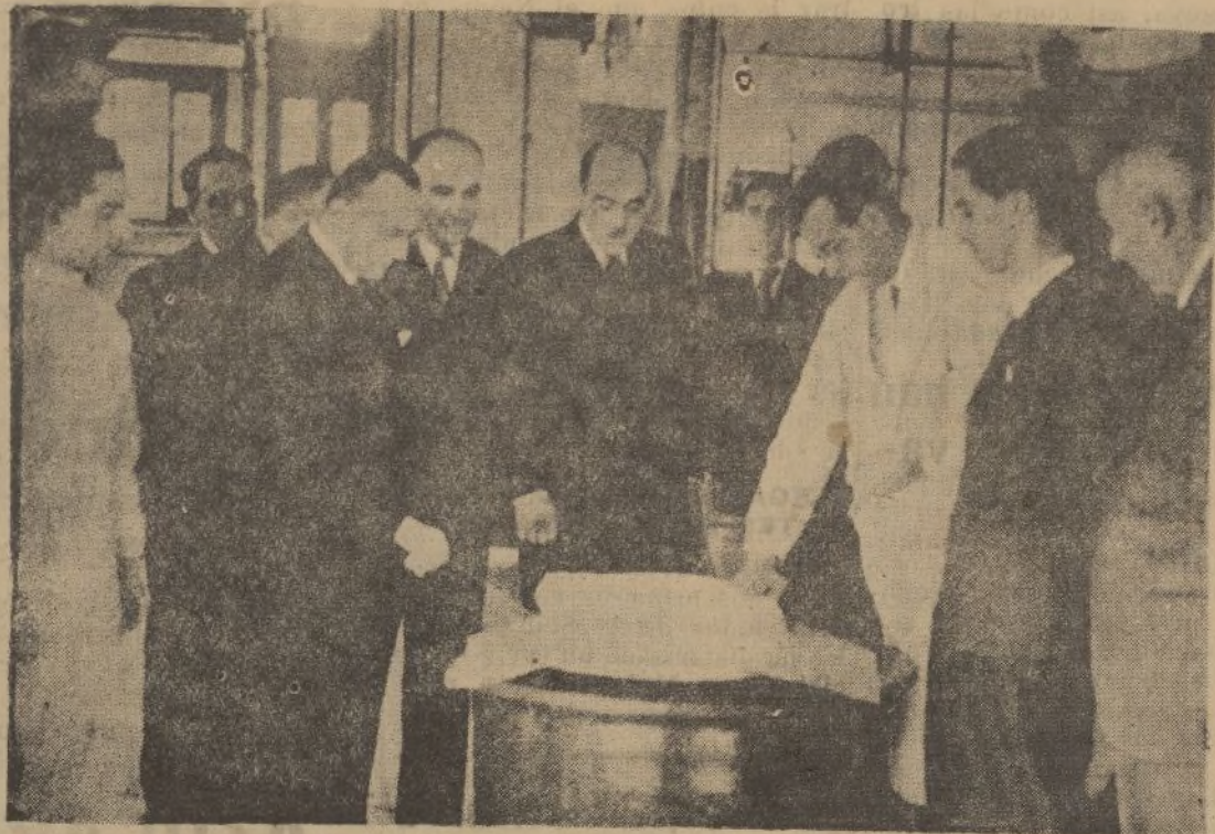
El ministro de Marina, don José Giral, durante la visita realizada a la fábrica Abelló, primera que en España se dedicará a la fabricación de alcaloides.