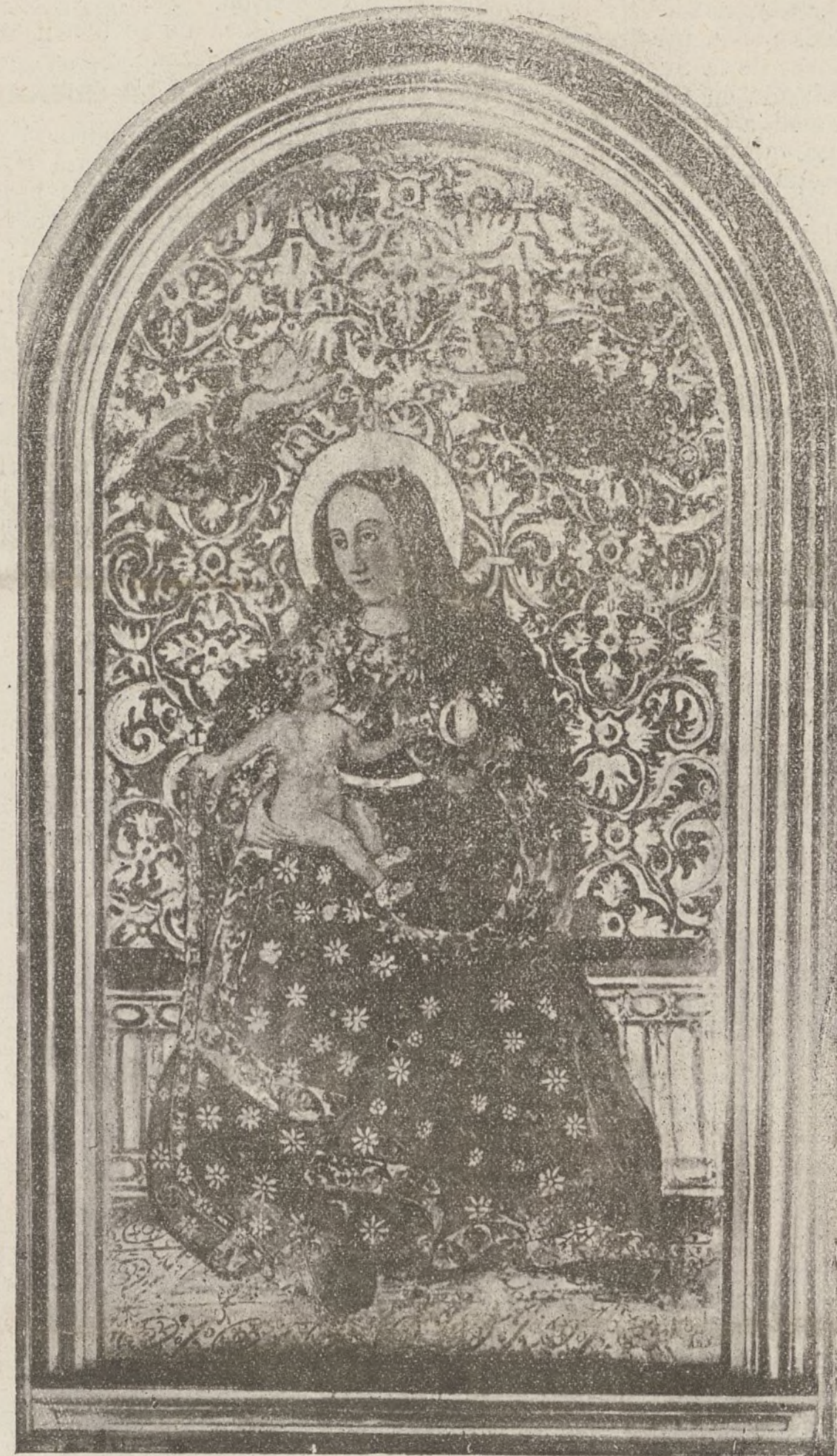
Nuestra Señora de la Cinta

Y allí comen, beben y se divierten como dos camaradas de toda la vida, como dos hermanos, y allí ven la procesión de la Virgen chiquita, reina de Huelva. Al verlos en la calle me han parecido un símbolo. Son Sevilla y Huelva, que están juntas, que viven juntas y que se quieren fraternalmente. Tienen tantos puntos de contacto y semejanza, que se hace difícil establecer diferencias... Ah, si se me ocurre una: Sevilla es capaz de pasear a Huelva por ti a,