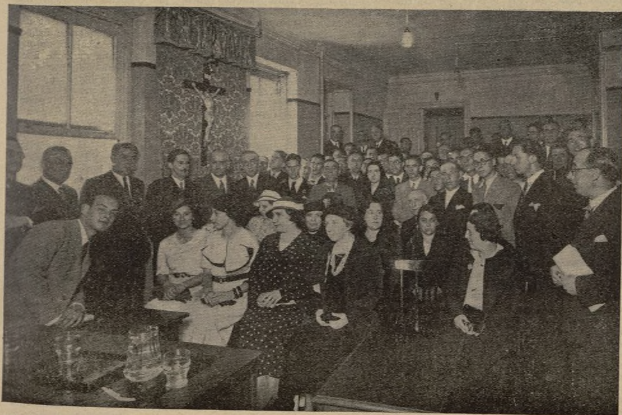
El diputado por Navarra, D. Rafael Aizpún, y asistentes a la inauguración de los nuevos locales de Acción Popular de Bilbao, que se inauguraron con gran brillantez el 17 de junio de 1934.