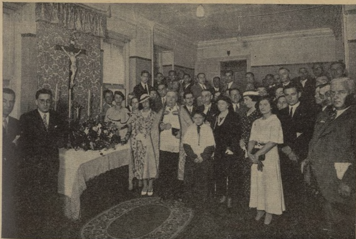
Momento de la bendición de los locales de Acción Popular en Bilbao el día 17 de junio de 1934.