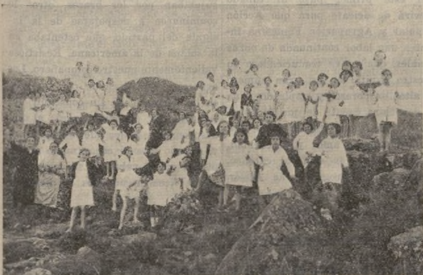
Alegres y felices las ciento veinte niñas de la Colonia, saltan y juegan por los pintorescos alrededores de la histórica Sigüenza.

la Caridad, de San Vicente de Paúl, están a su cuidado, inspeccionan cuidadosamente el estado de los delantalitos y el tocado de las pequeñuelas, antes de formarlas en filas de a dos para salir a dar un paseo, durante el cual rezarán el Santo Rosario. El paseo terminará a las ocho y media de la noche.