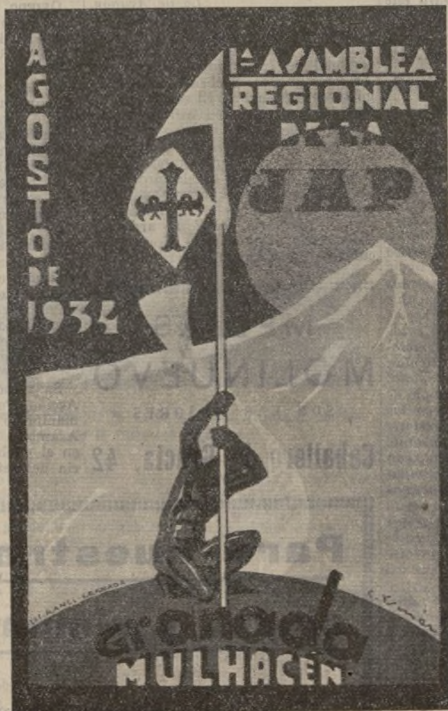
Facsimil del cartel anunciador de la Asamblea de Granada.

Durante el día, la temperatura es elevada, y las prendas de vestir deben ser, por consiguiente, ligeras. En cambio, en la noche son frecuentes y naturales las bajas temperaturas, por lo que el excursionista debe ir provisto de prendas de abrigo, tales como: jersey, camiseta de invierno, pellizas, etc., y una manta o capote.