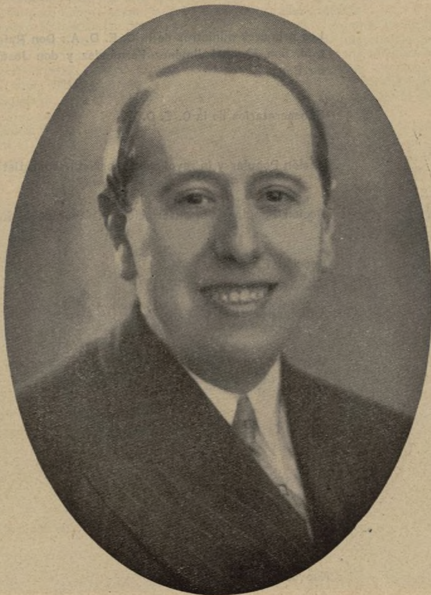
D. JOSE MARIA GIL ROBLES, Presidente de la C. E. D. A. El Jefe no necesita presentación.