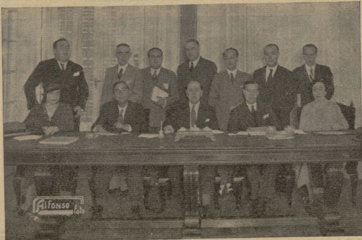
El señor Gil Robles presidiendo la reunión de la C. E. D. A.

Uno de éstos fué la creación en Cataluña de un partido político autónomo adherido a la C. E. D. A. El criterio que se había manteni-