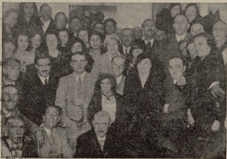
Grupo de asistentes a la inauguración del Centro Canillas-Vicálvaro.

El diputado por la provincia de Madrid, señor Martín Artajo, en elocuente discurso, se refirió a la