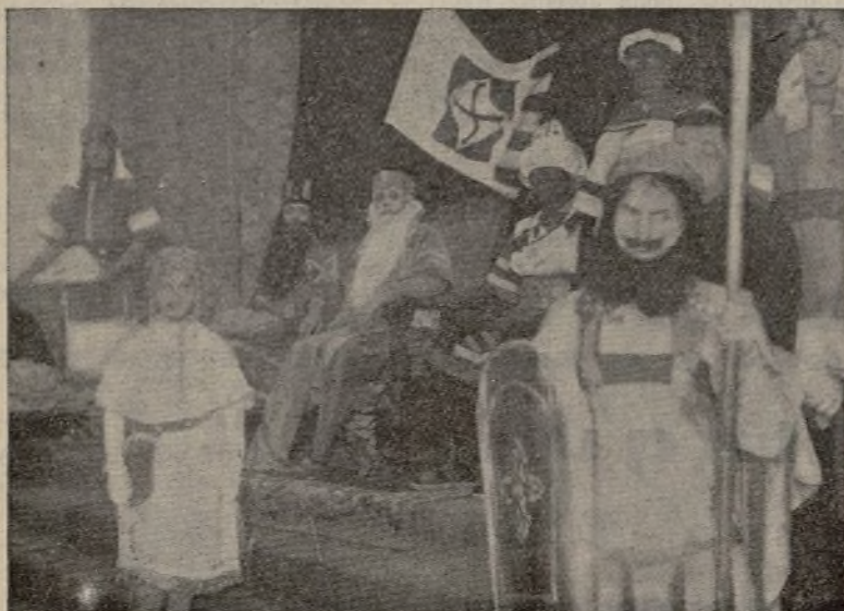
Los «Reyes Magos», bajo el pabellón de la J. A. P., disponiéndose a comenzar el reparto de donativos.

ra dar ambiente de fantasía al acto que se celebraba. Los ocho florones de la galería exterior fueron convertidos en adecuados pebeteros para quemar incienso durante las dos horas de desfile de los niños, con lo cual se logró dar estilo oriental a la parte exterior del edificio.