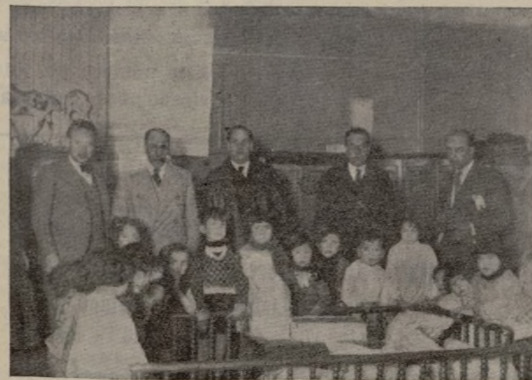
Un interesante detalle del reparto de juguetes a los niños pobres.

El éxito alcanzado es prnda segura de futuros triunfos.