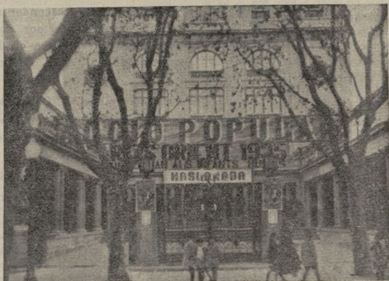
Aspecto del Teatro Gran Kursaal con el nombre de Acción Popular e indicaciones alusivas a la fiesta que en él celebró nuestra organización.

La recepción y ofrendas de sus majestades los Reyes de Oriente tuvo lugar en el teatro Gran Kursaal, el más espacioso de la localidad, adornado convenientemente pa-