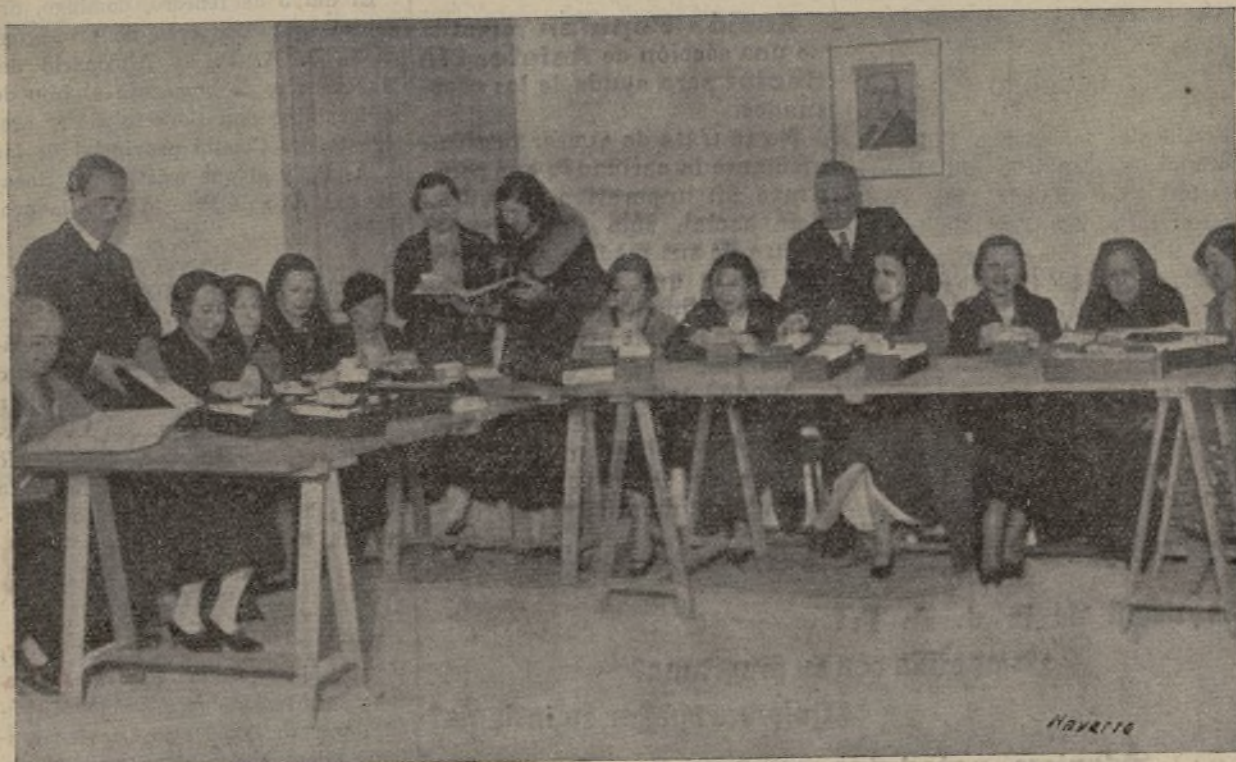
Grupo de señoritas que trabajan asiduamente en nuestro fichero de la Sección Electoral.

Hay que emprender, por lo tanto, una activa campaña contra la abstención, en la seguridad de que la victoria será nuestra, si logramos que dicha abstención quede reducida a los casos de verdadera imposibilidad.