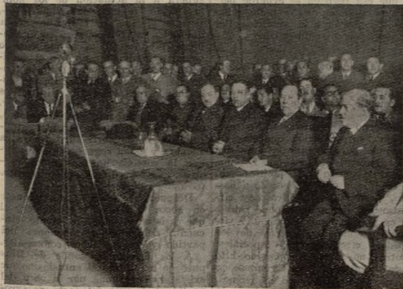
La presidencia del acto que se celebró en Tarragona en el Teatro Moderno.

Al Gobierno de coalición que actúa en estos momentos le cabe un gran trabajo: liquidar el movimiento revolucionario. Esto tenía dos fases: una, la violenta, en que la masa se echó a la calle a luchar contra las fuerzas del Estado; otra, la que, una vez vencida la revolución, impone la desconexión total de los elementos revolucionarios. La primera se realizó aun con el temor de que las fuerzas del Estado habían sido minadas moralmente durante los años en que la revolución preparó la labor. Y cuando todo estaba minado nos criticaban. ¡Yo hubiera querido que ellos hubieran estado con la zozobra y el temor de nosotros aquella noche en que no sabíamos si a la mañana siguiente habría un Estado civil o un Estado de barbarie! Lo otro se está haciendo con dificultades, hay que reconocerlo; pero mientras la C. E. D. A. tenga su fuerza y empuje, se aplicarán todas las sanciones. No me preocupan tanto las armas como la disposición espiritual del pueblo. Que no haya ese fermento de odios, clima de venganza tan favorable para que pueda repetirse el movimiento revolucionario.