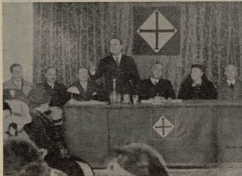
Mesa presidencial del acto inaugural del Centro de barriada, Centro-Hospicio