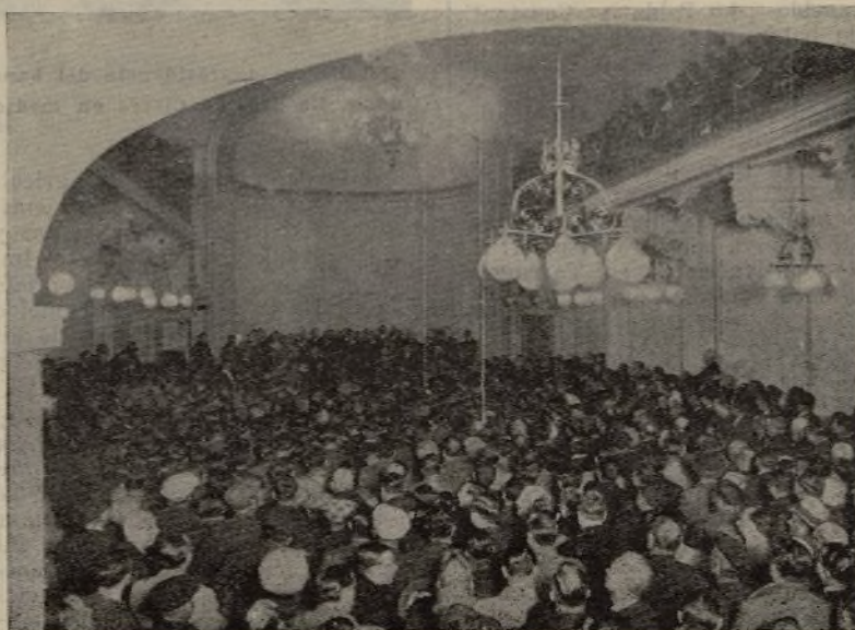
El señor Gil Robles dirigiendo la palabra al público, en el «Circol Agricol», de Vilafranca del Penadés.

—Sí—respondió el señor Gil Ro- bles—. La autonomía conveniente, con arreglo a los Estatutos del par- tido, para desarrollar en Cataluña la política más eficaz. El mismo Consejo regional decidirá si es opor-