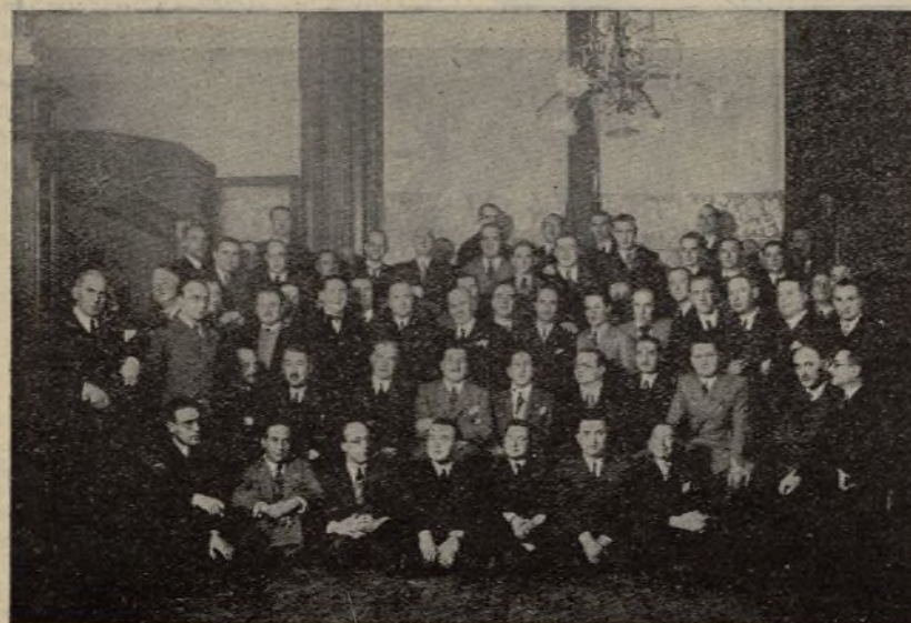
Concurrentes al banquete celebrado en el Palace Hotel con motivo de la constitución de la Derecha Vasca Autónoma en Irún, con representación del Comité Provincial de Guipúzcoa y local de San Sebastián.