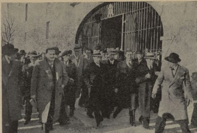
El Sr. Gil Robles, saliendo de la iglesia de la Misericordia, de Reus, de oír misa.

ver pronunció un discurso en catalán. Dijo que se expresaba en lengua catalana porque los corazones que se aman se entienden siempre. Aludió a la necrópolis romanocris- tiana de Tarragona, y dijo que ello es muestra de que antes que cata- lanes eran cristianos. (Aplausos.) Fi- nalmente habló el señor Gil Robles. Dijo que agradecía a los oradores se expresasen en catalán. Me satis- face esta cordialidad, porque la len- gua catalana a los hijos de Casti- lla nos suena tan gratamente como la materna. Es preciso rendir culto a la lengua, porque élla es la expre- sión simbólica de la espiritualidad de un pueblo. Es preciso establecer contacto con todas las clases socia- les. Hay que tener espíritu cristia- no y devolver bien por mal, y no actuar con espíritu de revancha ni represalia. Hemos de ahogar el mal con la bondad de nuestras actua- ciones. (Aplausos.)