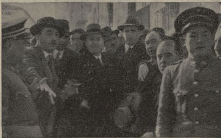
En Mancha Real.

En la Asamblea provincial del partido, celebrada en el teatro Cervantes, de Jaén, se reunieron cua-