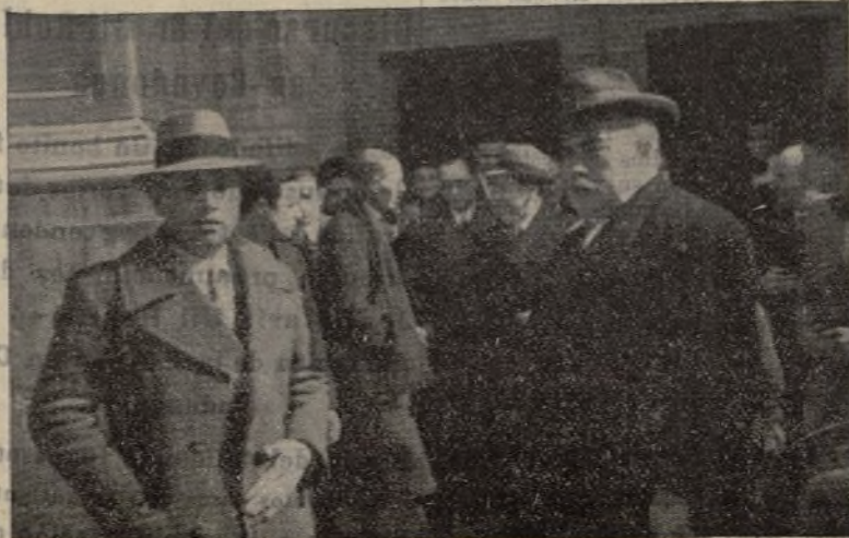
El Sr. Gil Robles y sus acompañantes a la salida de la Catedral de Jaén.

Con la caída de la monarquía, no cayó ésta solamente, sino que con ella cayeron todas las organizaciones políticas de derechas, aquellas representaciones de la política que eran entonces fundamentales en España. Al entrar nosotros en las Constituyentes, nos encontramos sin organización, sin un sistema ni ideario común. Teníamos pendientes los problemas social y agrario y había que defender los intereses de España. Por eso, después de varias reuniones