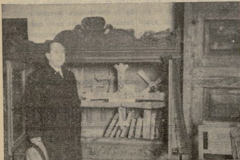
El Jefe ante el Relicario donde se conserva la Cruz de la Victoria.