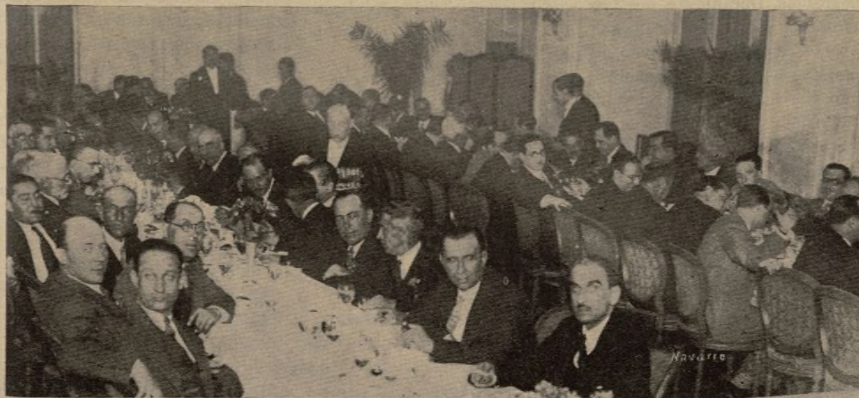
Un aspecto del banquete ofrecido por la minoría Popular Agraria al señor Gil Robles y a los ex ministros de la C. E. D. A.

La reunión del Consejo terminó a las dos de la tarde."