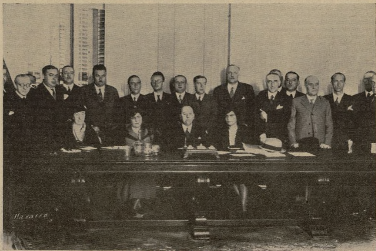
La reunión del Consejo Nacional de la C. E. D. A. presidido por el señor Gil Robles.

Se aprobaron las bases para las relaciones entre Acción Popular y