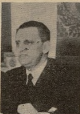
D. Pascual Díez de Rivera, marqués de Balterra, capitán de corbeta.