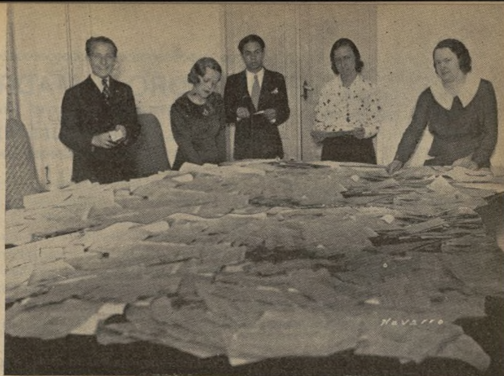
Acción Popular recibe millares de telegramas de felicitación por su actuación política. Un departamento en plena clasificación.