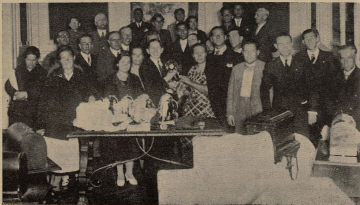
Momento de la entrega de las máquinas de coser desempeñadas a sus dueños.