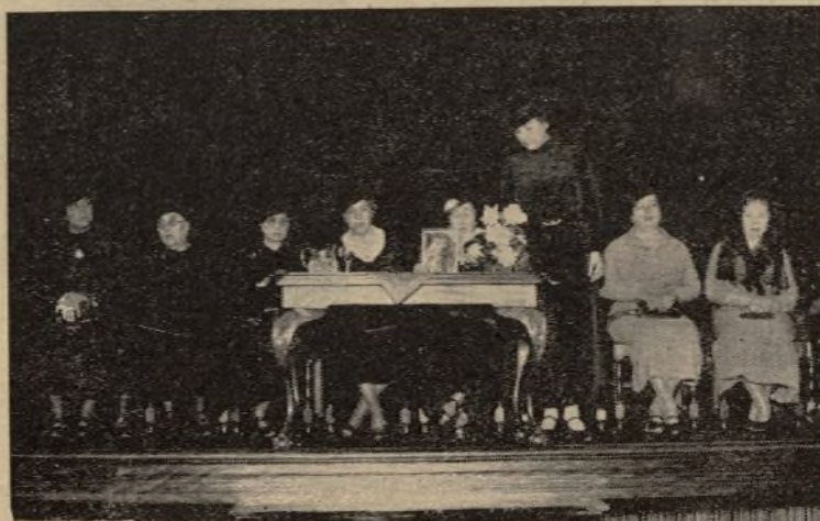
La Junta directiva de Acción Popular de la Mujer, de las Palmas, en la presidencia del acto celebrado con extraordinario éxito el domingo 28 del pasado en el «Hollywood Cinema» de las Palmas.