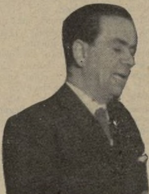
Don Jesús Pabón, ex director general de Trabajo y diputado a Cortes por Sevilla.

maban a sus componentes y la desaparición de esa Junta, y, por último, se refiere a la hoy existente, creada en 26 de julio de 1935.