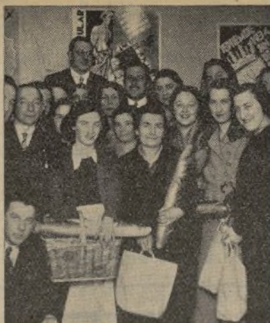
Reparto de comestibles por la Sección Femenina de la D. V. A.

La Asociación Femenina de Acción Popular de Melilla ha