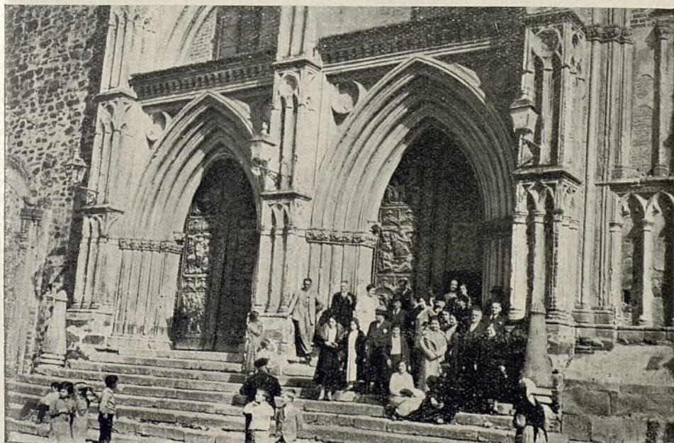
Fachada principal del Monasterio

En el interior, innumerables riquezas artísticas, debidas, en su mayor parte, a artistas italianos. Gerardo de Merlo, Carduci y Caxés, constructores del retablo mayor. Egas, autor del enterramiento de Velasco. Cuadros en la capilla de Santa Ana; Torrigliano, genial autor del San Jerónimo, escultura policromada de barro cocido; Lucas Jordán, decorador del camarín de la Virgen; Churriguera, artífice de la sillería del coro.