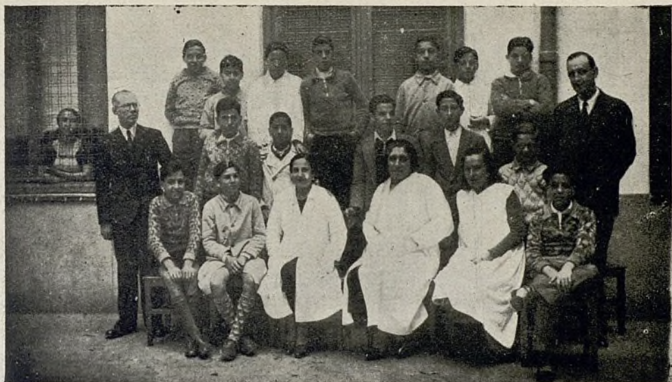
Comisión rectora de la Cantina escolar Pardo Bazán