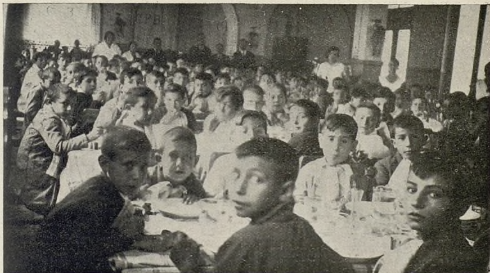
El comedor del Grupo escolar Pardo Bazán en plena actividad