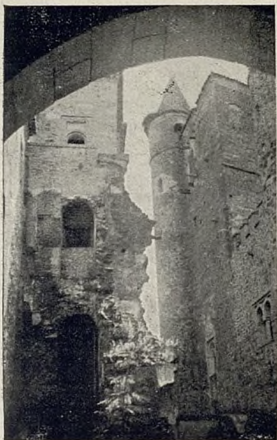
Un rincón de Guadalupe