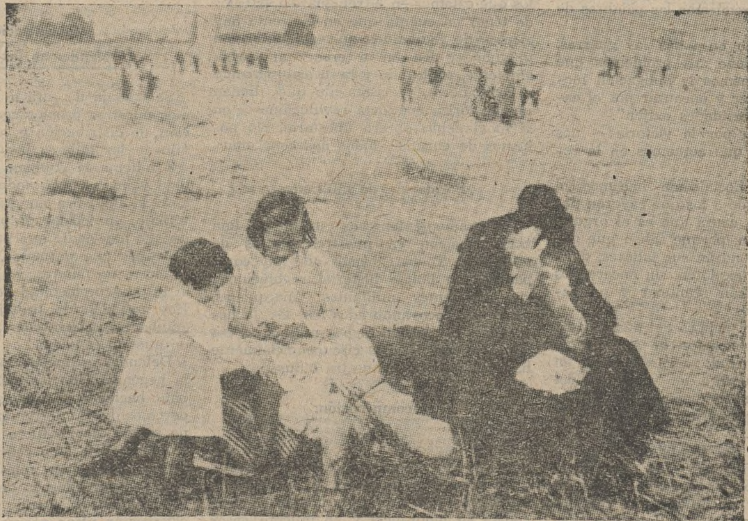
Huyendo de los fascistas. — Un pequeño descanso para reemprender el viaje a pie en busca de albergue

S. I. A. , con su amor, cicatriza las heridas que el fascismo abre en los cuerpos de todos los amantes de la libertad.