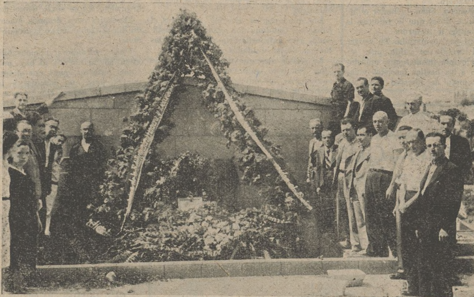
El Sindicato no olvida a los más sinceros y abnegados anarquistas que han muerto envueltos en una aureola de gloria, y deposita unas flores en su recuerdo en la tumba de Buenaventura Durruti.

Salvándonos nosotros de la garra del fascismo salvamos a toda la Humanidad. Para ello no debemos regatear esfuerzos ni sacrificios. Todo cuanto se haga a tal fin será poco comparado con el esfuerzo que el enemigo está llevando a cabo para aniquilarnos.