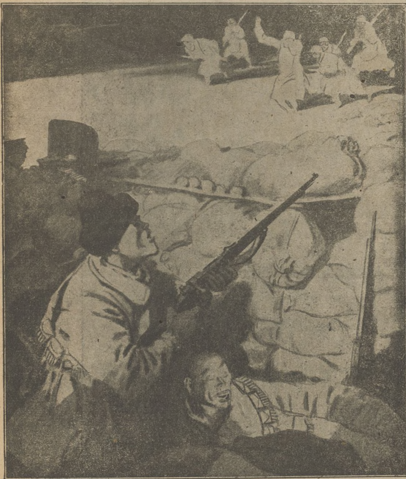
LA NUEVA LOCURA JAPON-CHINA 1938

Nadie puede olvidar que el pueblo está haciendo un sacrificio supremo, que ofrenda miles de vidas de sus hijos en defensa de la causa de la libertad.