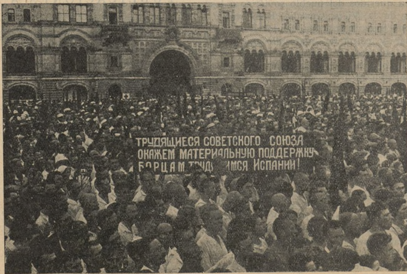
Mitin en favor de España. 120.000 moscovitas en la Plaza Roja de Moscou.