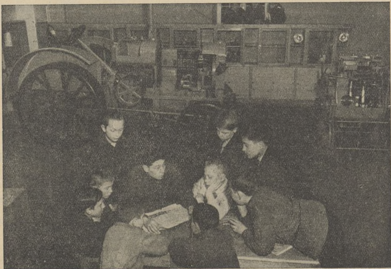
PALACIO DE LOS PIONEROS EN KHARKOV.—El instructor del Laboratorio de Tractores, antes de mostrar a los niños el modelo, les da una breve charla preliminar.

La nueva estación de Vinnitsa (Ukrania) ha sido inaugurada hace pocos días. Esta estación está dotada de todo el confort que las estaciones de ferrocarril de la U. R. S. S. poseen. Contará, entre estas mejoras, con un edificio destinado a las madres que viajan con sus pequeñuelos, que consta de seis grandes salas, una sala de duchas y un dormitorio amueblado con un buen número de cunas niqueladas, un salón de juego para los niños y dos salas de espera. Varias enfermeras están a disposición de las viajeras.