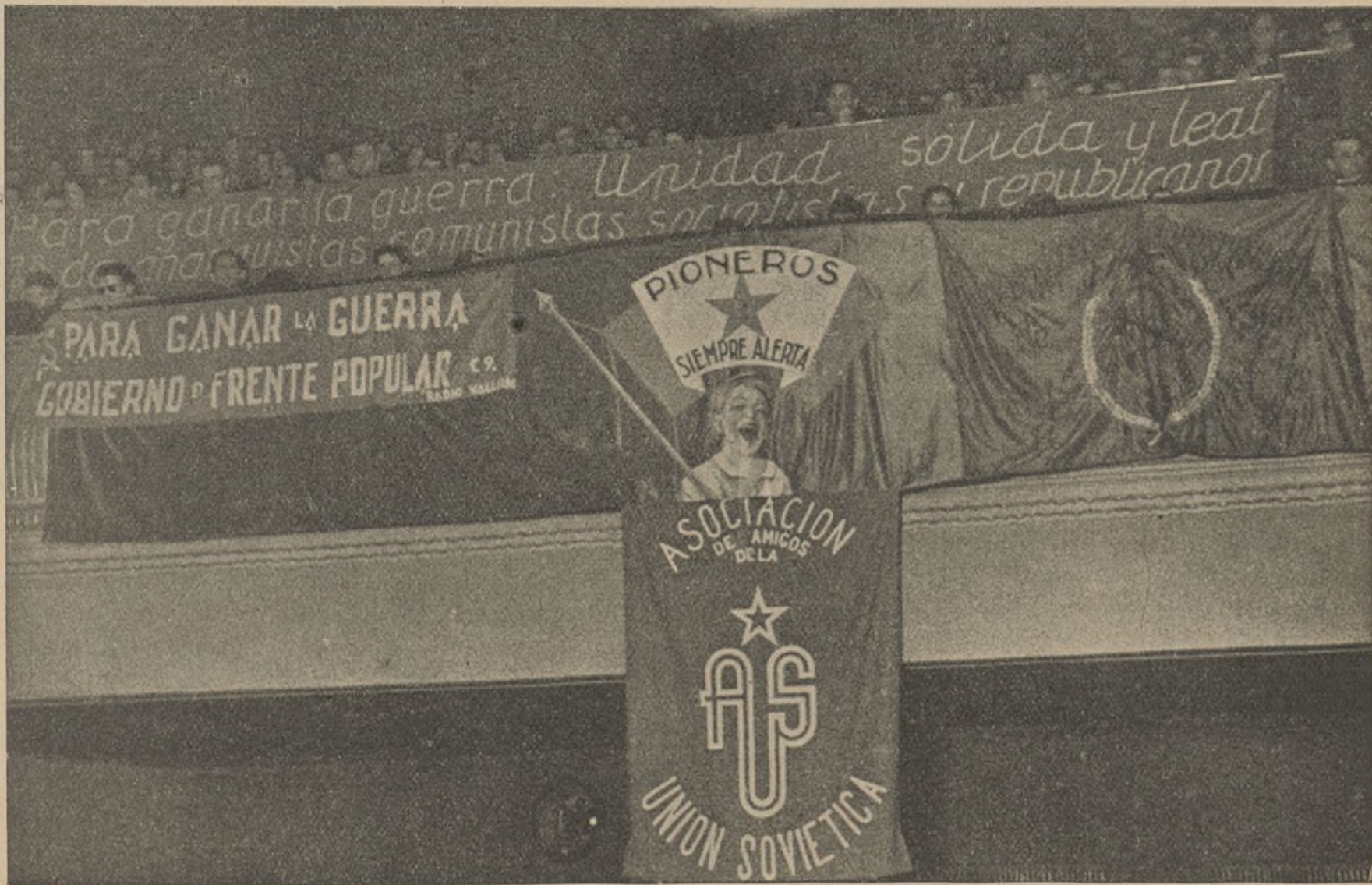
Mitin de simpatía y gratitud hacia la U. R. S. S.: Un aspecto de la galería.

El día 20, y en el Campo de Pioneros de Artek, se ha celebrado una gran fiesta, a la que han concurrido más de 2.000 personas, entre las que figuraban hombres de ciencia, escritores y koljosianos. La Delegación francesa fué la primera en llegar, haciéndolo poco después las Delegaciones inglesa y americana, que fueron alegremente recibidas por los pioneros. Pero cuando el entusiasmo de éstos llegó a ser verdaderamente delirante, fué en el