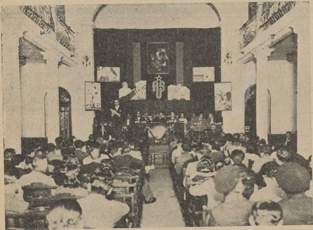
Aspecto parcial de la Asamblea Provincial de los A. U. S., de Madrid.

c) Cursar un telegrama de adhesión al Presidente de nuestro Gobierno del Frente Popular.