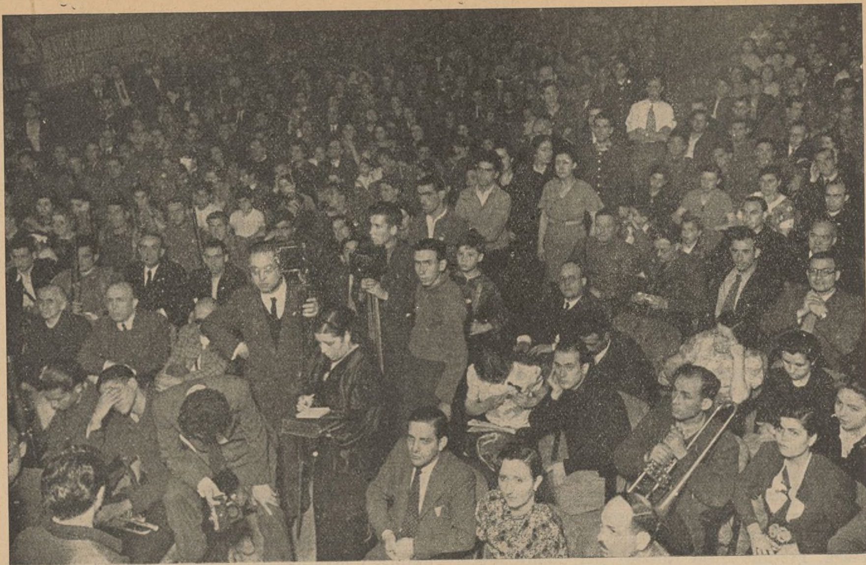
Un aspecto de la sala durante la celebración del acto.