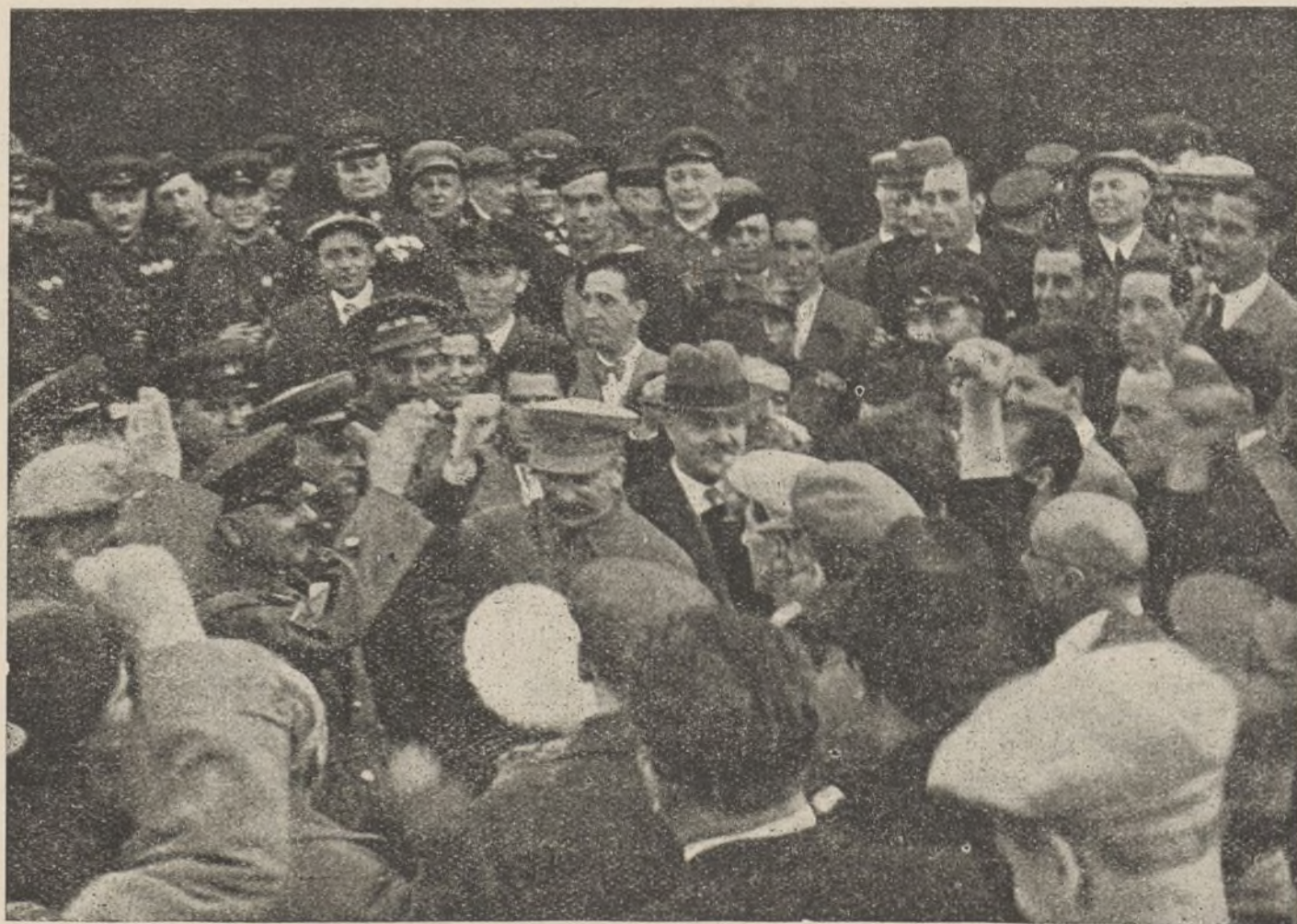
Los dirigentes del pueblo soviético saludan a la Delegación española.

Las Delegaciones de la Rusia Soviética nos traen mensajes demostrativos de cómo ha sido posible