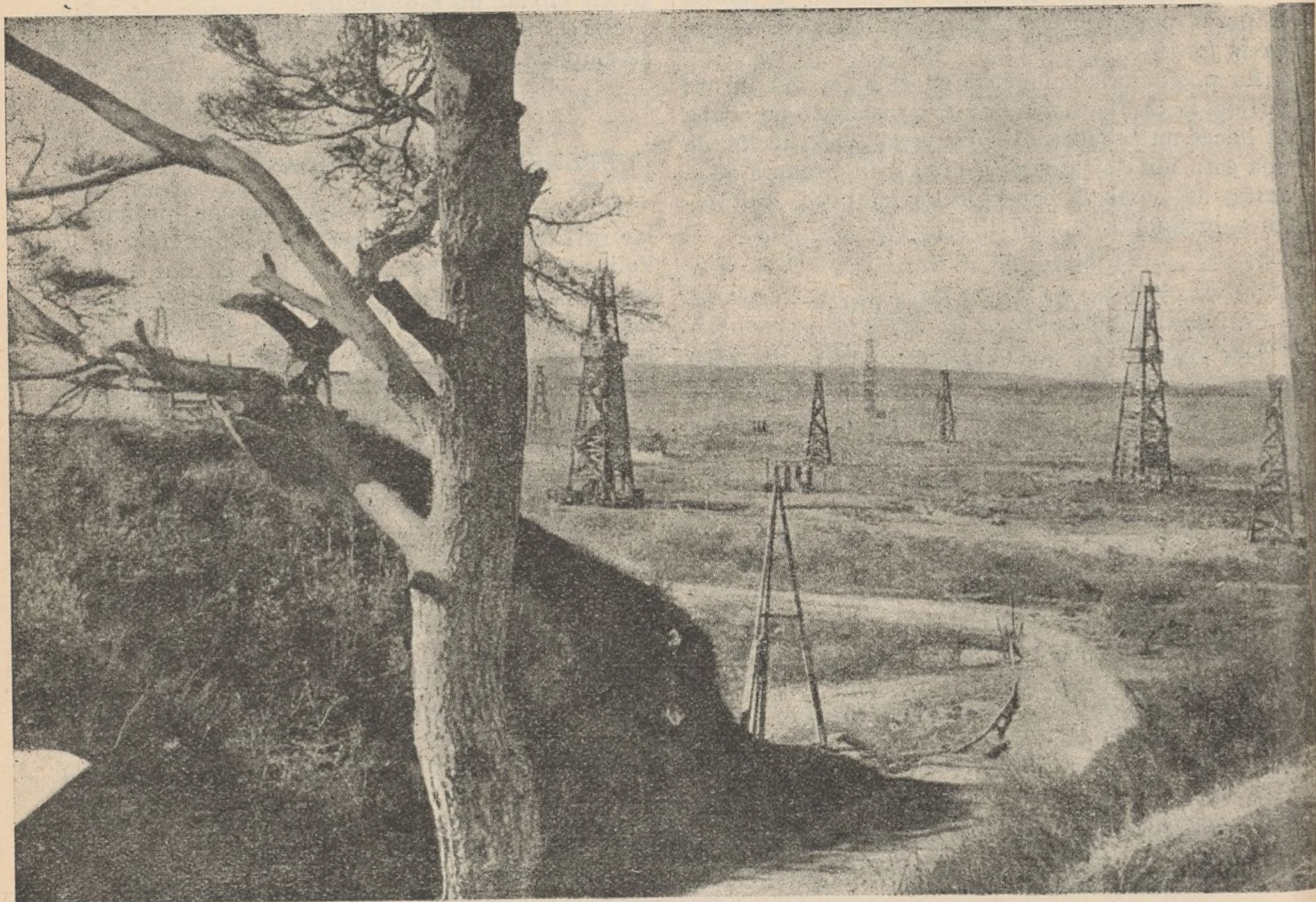
Nuevo yacimiento de petróleo descubierto en la República soviética de Balkiria que arroja 3.000 toneladas diarias. Dicen los expertos que es tan grande como los de las regiones petrolíferas de la costa Este de los Estados Unidos de América.

Un grupo de aviones se prepara para la lucha