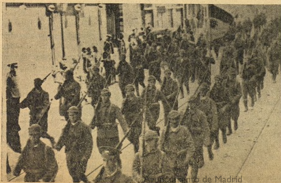
Marcial desfile del Ejército de la República

(Radiado en Madrid el día 6 de agosto, a la una y media de la madrugada de 1937.)