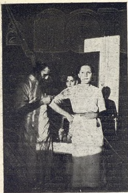
Una de las 5.600 inyecciones que van aplicadas por la Profesional de Medicina, completamente gratuitas, para evitar posibles epidemias

Aunque la Federación Universitaria Escolar la caracteriza su apoliticismo como tal organización estudiantil, bajo el denominador común de antifascista, no podía por menos, y en ello está todo su orgullo, de contribuir en todos los aspectos al aniquilamiento total de los que un día vendieran la Patria al fascismo extranjero e invasor. Por que no desconocían lo que esto supondría, de haberse realizado, para nuestras libertades, la F. U. E. no dudó en unirse a los que a la Sierra iban a cerrar el paso a los generales sublevados contra el pueblo. Y en el transcurso del año largo que llevamos de guerra contra el fascismo, han sido muchos los «fueístas» que, encuadrados luego en batallones y brigadas del Ejército popular, han sabido dar su sangre por España, por una España libre y limpia de invasores que la dirijan. Por esto dió su vida, entre otros compañeros, aquél héroe Carrasco, y como de él, de cuántos más de la F. U. E. podíamos decir lo mismo. Pero por si esto fuera poco la F. U. E. ha coadyuvado a la guerra desde otros múltiples aspectos, gran parte de ellos dedicados a la conducción de la juventud estudiantil y, en otro aspecto, al estado sanitario de la retaguardia madrileña al crear un Centro de vacunación,