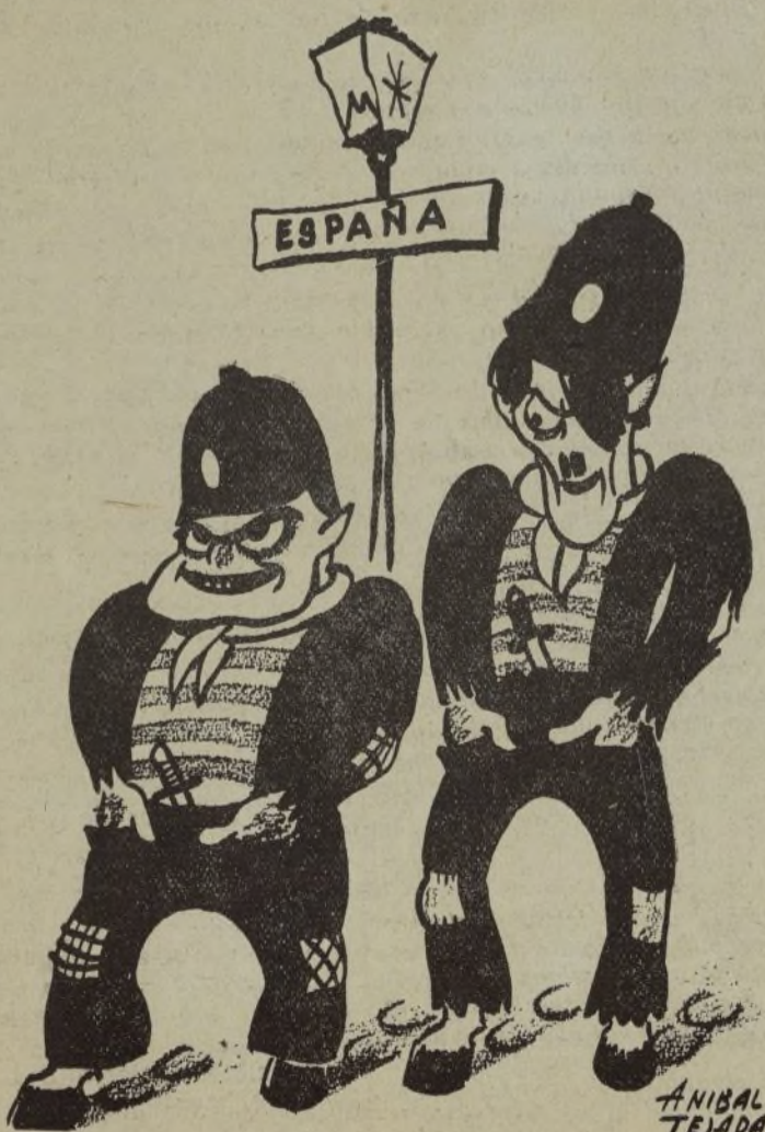
LOS DOS INCONTROLADOS DEL «CONTROL»