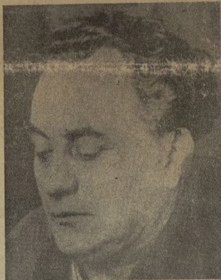
J. DIMITROV Secretario general de la Internacional Comunista

los ejércitos extranjeros. Las batallas de Guadalajara y de Extremadura son recientes para probarlo. Donde no había nada, ha surgido algo de grande. De las antiguas milicias sin táctica militar y sin cuadros, se ha constituido el Ejército del pueblo, más poderoso que todos los ejércitos que conoció España. De la antigua carabina surgió una potente aviación que hace reflexionar mucho a Hitler y a Mussolini. Estos resultados se deben a la unión del pueblo español, a su sacrificio y a su disciplina que los rebeldes no esperaban. También el proletariado inter-