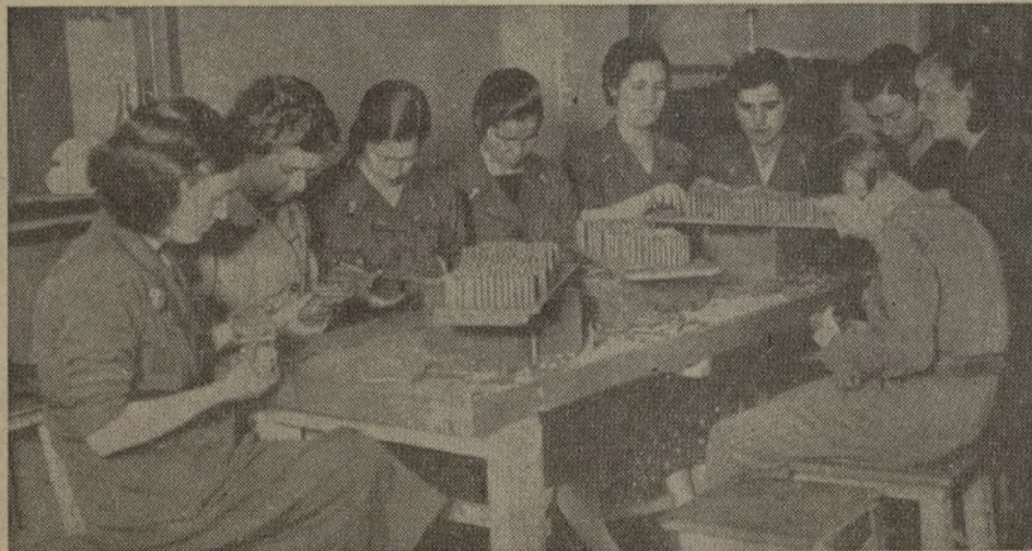
En las fortificaciones, en las fábricas, en los talleres, la actividad de la mujer es una ayuda inmensa al padre, al hermano que combaten por la independencia de nuestra Patria y la Libertad del mundo entero