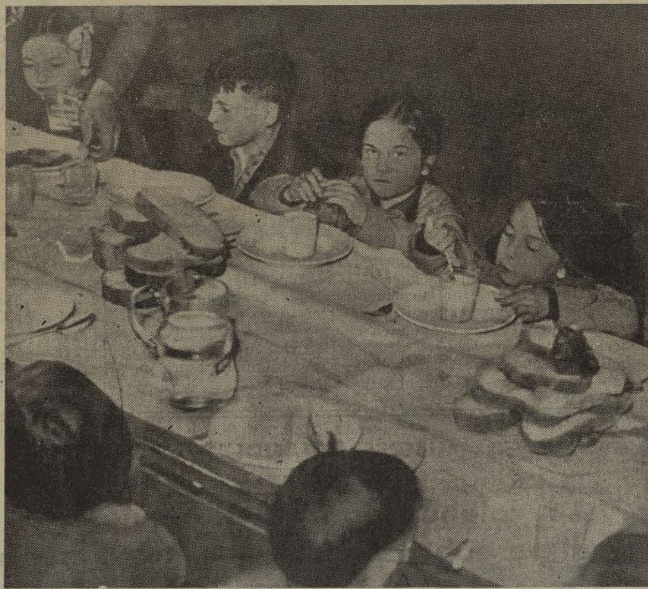
Niños vascos recogidos por el pueblo francés

He visto otra niña española; en un bonito jardín infantil cerca del Parque Montsouris. La familia que la ha adoptado