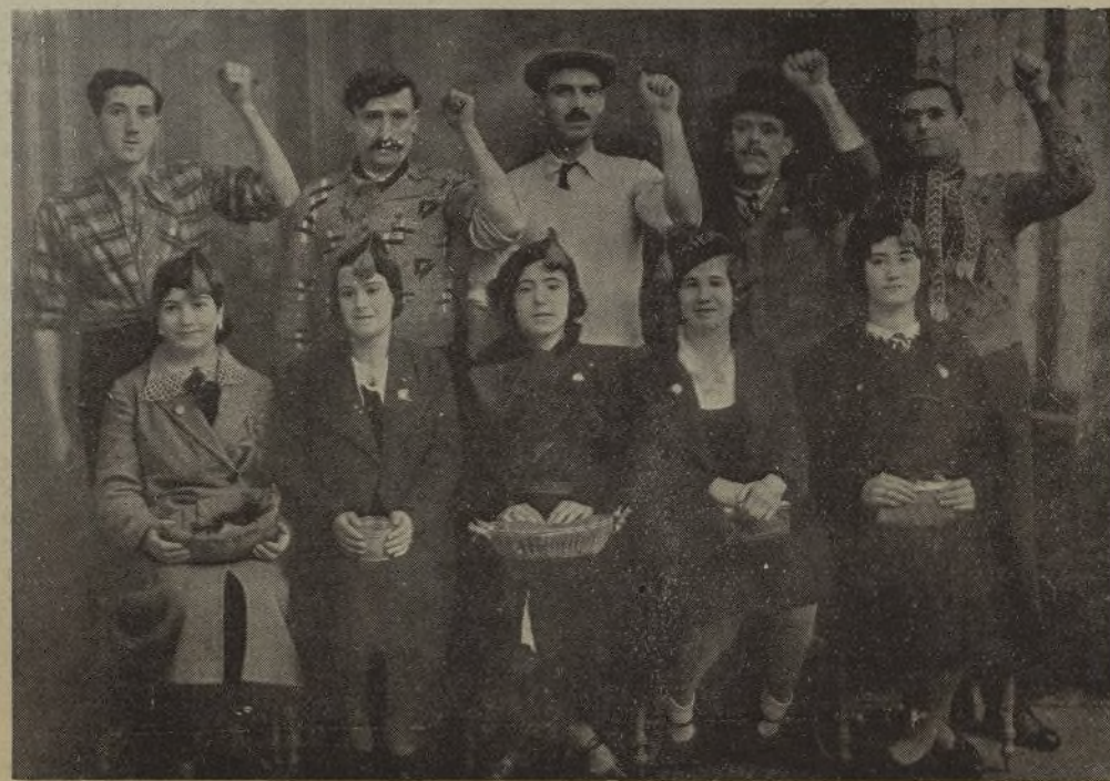
El Comité de Allevard (Ysère) uno de tantos que ayudan al pueblo español.

De esta gran asamblea, se han obtenido conclusiones alagüeñas. Con ella el Comité Nacional resfuerza notablemente su autoridad, liquidando las pequeñas manifestaciones de trabajo fraccional, haciendo más sólida la unidad en la ayuda y en la solidaridad al pueblo antifascista español. Con ella, la asamblea, el Comité Nacional cía entre todos los núcleos españoles de la inmigración económica. Y se sitúa frente