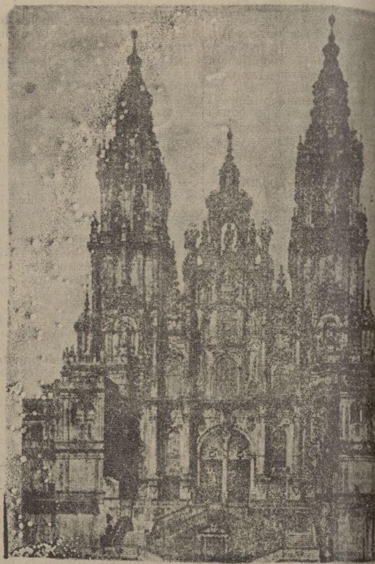
Santiago de Compostela.-La Catedral

Tiene frases ridiculizando la huida de los elementos de Valencia a la ciudad condal, y después de otras amplias consideraciones alusivas al final de la guerra, lee los «camelos», da cuenta de las operaciones, y lee la lista de donativos entre los que figuran algunos valiosísimos entregados por el obispo de Cartagena procedentes de Bolivia, Montevideo y República Argentina.