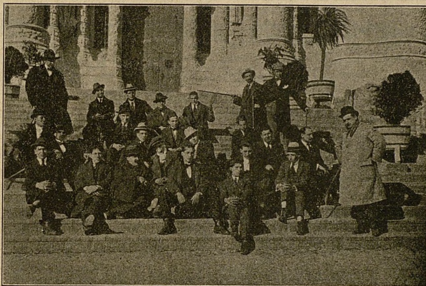
Grop d'assistents a la festa íntima celebrada pel "Grop de Declamació"

Rebin els nostres amics reconeixent l'èxit, nostre sincera i coral felicitació.