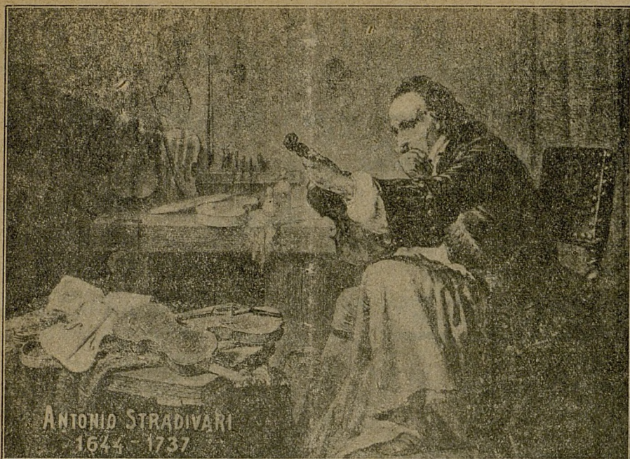
ANTONIO STRADIVARI 1644 - 1737