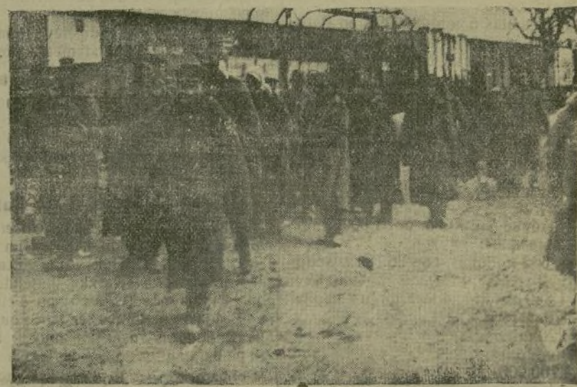
Llegada a una estación de Alemania de un tren sanitario.

1.ª El ganado caballar, mular, asnal, vacuno, lanar, cabrio y de cerda propiedad de vecinos de los pueblos situados en las provincias de las fronteras terrestres deberá estar inscrito en un registro especial que tienen obligación de llevar los alcaldes del término municipal en que residen los dueños, con intervención de la Aduana más próxima, o en su defecto del jefe del resguardo de la sección respectiva: para pastar y circular dichos ganados por las mencionadas provincias deberán ir acompañados de una certificación de su inscripción en el registro anteriormente citado, expedida por el secretario del Ayuntamiento y