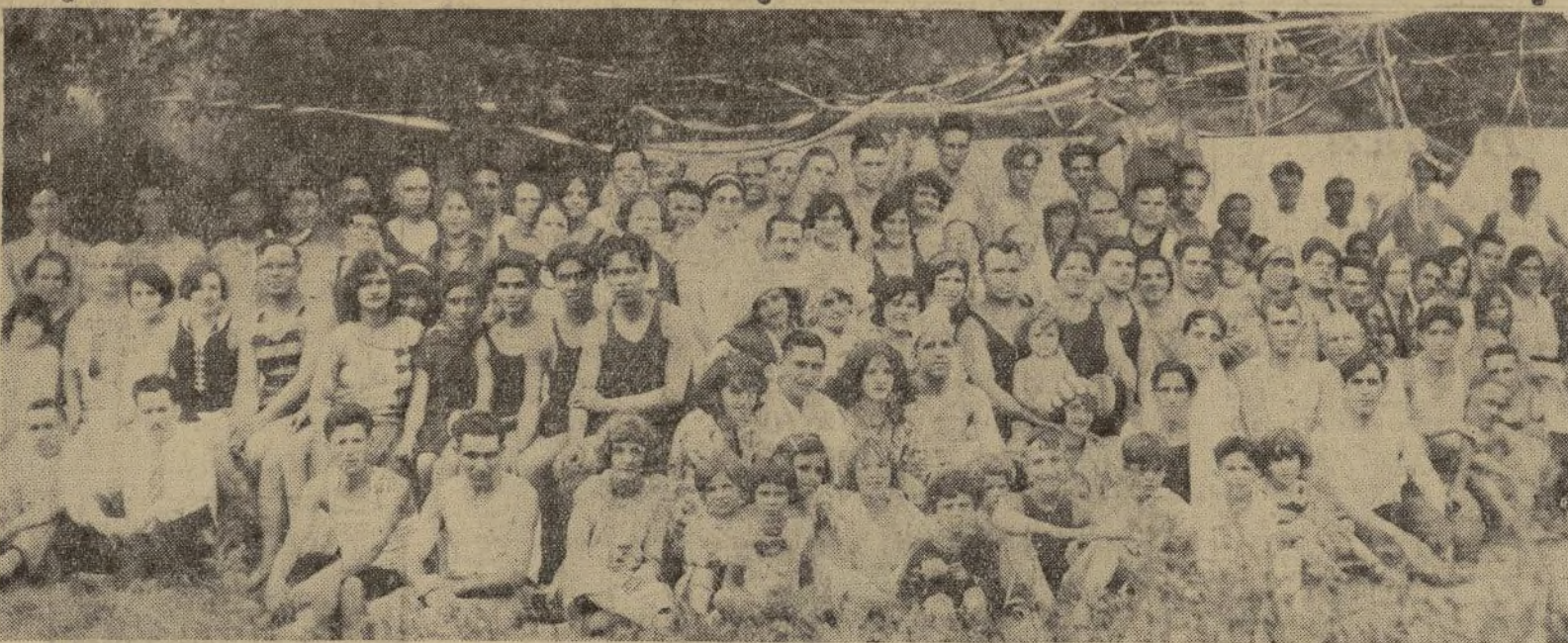
Sin decaer la animación y entusiasmo, tuvo lugar el pasado domingo la fiesta campestre organizada por la Sociedad Naturista Hispana. He aquí un grupo numeroso de los asistentes, quienes a pesar de no ser muy favorable el tiempo, acudieron al pintoresco lugar donde tiene establecido el campamento de verano la activa entidad, propagadora de los ideales naturistas.