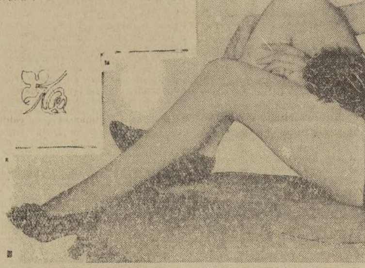
Alice White, la nueva "sensación" cinematográfica, en una escena de "Broadway Ladies", actualmente en proyección en el "Central".