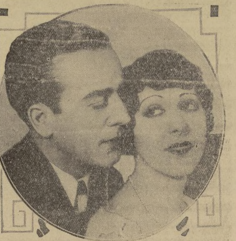
Patsy Ruth Miller y Jack Oakie, protagonistas de "La Carta", que se exhibe esta semana en el "Stand".

Con el ejercicio físico, lo mismo que con las medicinas, hay que proceder con cautela. Lo mismo que puede hacernos mucho bien si lo practicamos en dosis y a su hora adecuada, también puede propor-