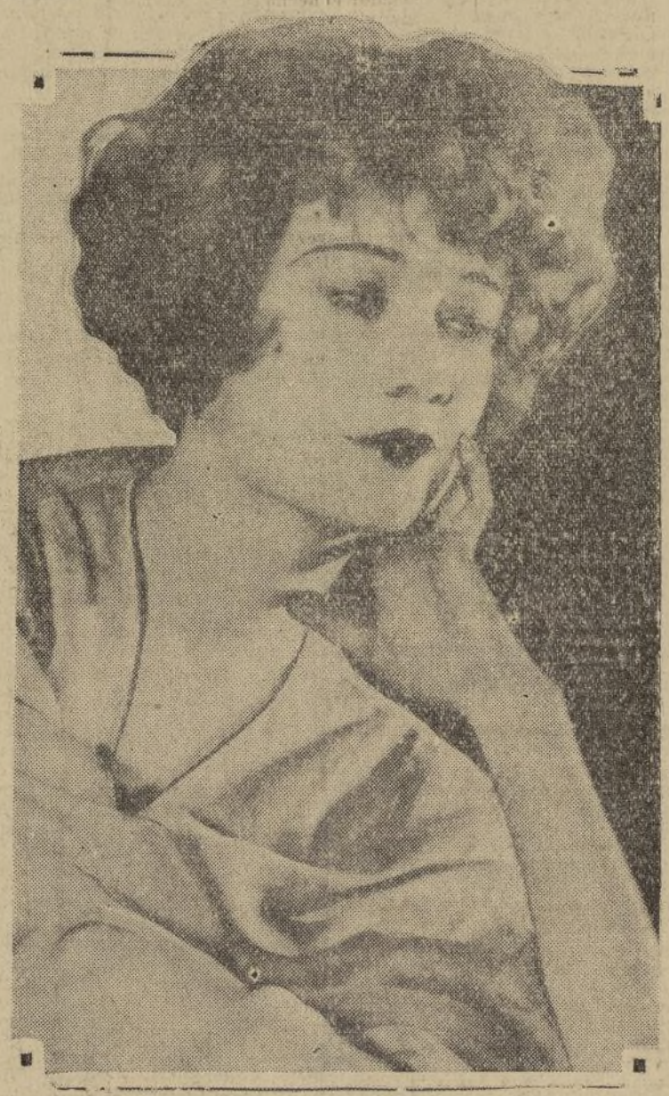
"The Camel Through the Needle's Eye" sigue triunfando en el "Guild", lo que se atribuye en parte a Miriam Hopkins.

cionarnos mucho mal al salirnos de las reglas. Al igual que ocurre con las medicinas también, no vale tomar de una sola vez lo que debe ser tomado en varias. Supongamos que dedicamos quince minutos diariamente al ejercicio de respiración. Nuestro cuerpo, recio en un principio a todo esfuerzo, va acostumbrándose poco a poco a cada día y una cierta cantidad de energía y recibe en cambio una cierta cantidad de oxígeno. Todos los órganos están pendientes de este ejercicio y si pasa un solo día sin que lo practiquemos sentiremos el consiguiente malestar. Al día siguiente, con objeto de ganar lo perdido, en vez de quince minutos, alargaremos el ejercicio hasta treinta. ¡Error doble! Nuestros músculos no están acostumbrados a desplazar tal energía haciendo un perjuicio. Lo mismo o parecido ocurre cuando pasa una temporada sin hacer ejercicio alguno y después comenzamos. El cuerpo se resiente, la sangre sufre la transformación de una gran cantidad de sustancias y tiene que acelerar la circulación para regular su presión. Por el contrario, si somos metódicos en el ejercicio, las quince minutos que diariamente le dedicamos serán una especie de renovación de nuestra vitalidad y podremos descansar tranquilos sabiendo que nos estamos haciendo un gran bien, tanto físico como moral. La regularidad y la perseverancia, es pues, el elemento principal en el ejercicio. (Sigue en la 6.ª pág.)