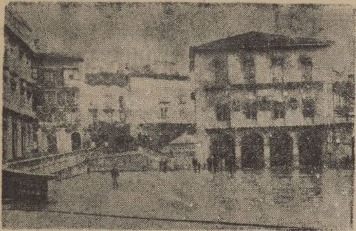
LEQUEITIO.—Plaza de los Fueros