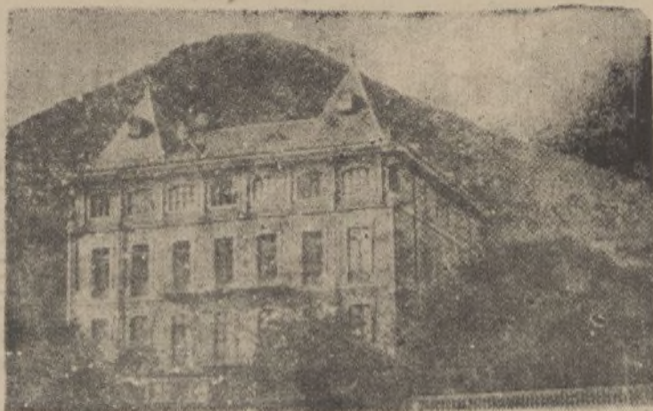
LEQUEITIO.—Palacio de Uribarren y Calvario

Laxen Busto Laxante que educa el intestino