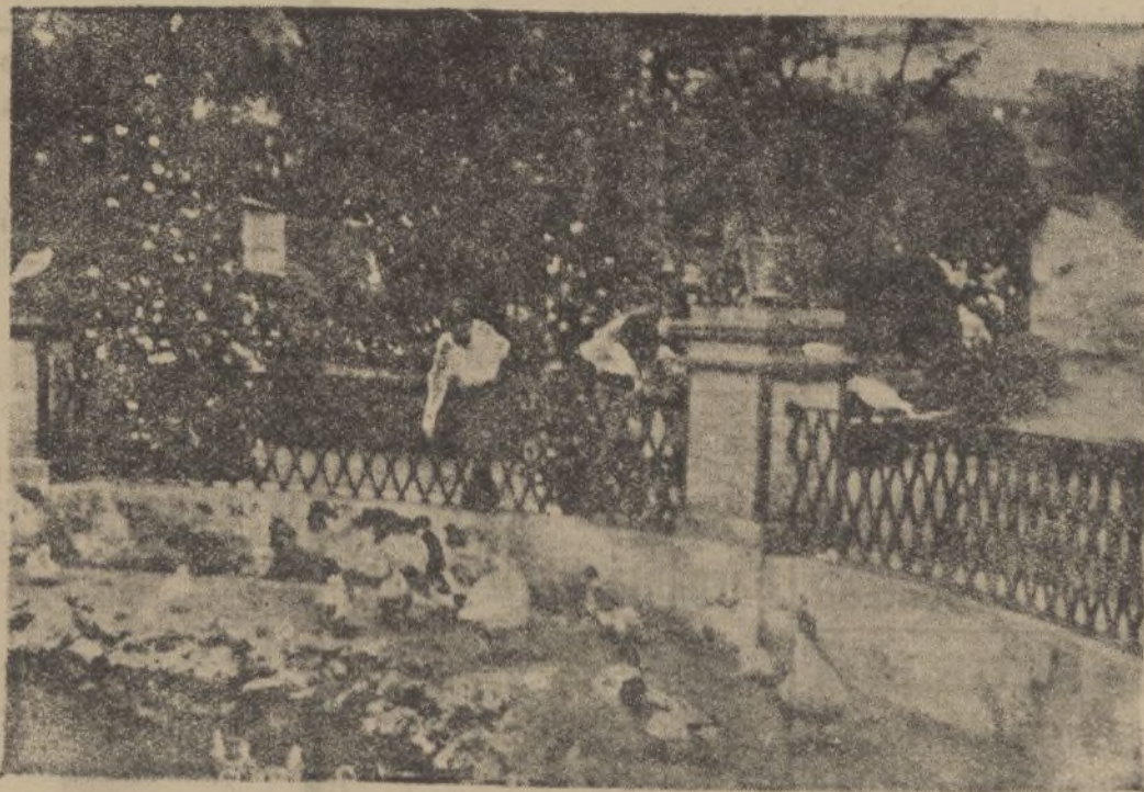
El estanque de los patos