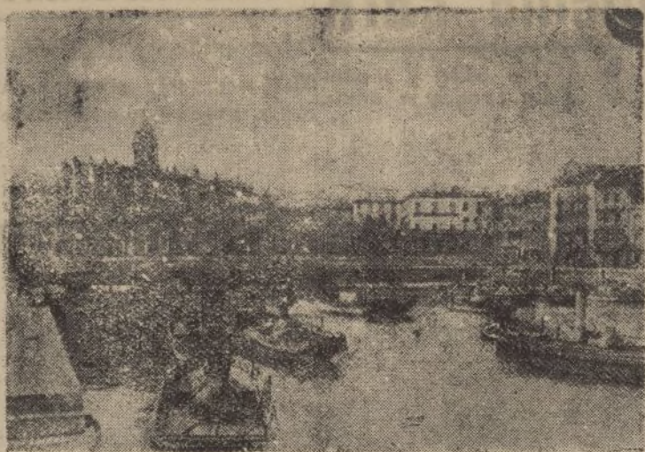
LEQUEITIO.—Vista parcial del puerto