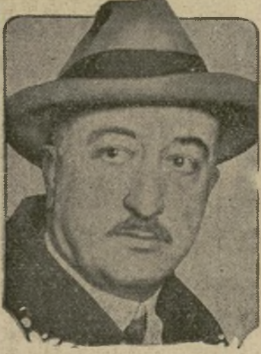
Dr. Orestes Ferrara y Marino