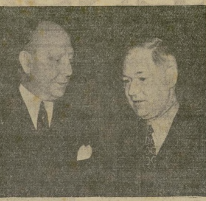
El alcalde Frank Hague, de Jersey City, a la izquierda, al negarse a aceptar el nombramiento de senador que le ofreció el gobernador A. Harry Moore, de New Jersey. Manifestó Hague que prefería permanecer en Jersey City para seguir su campaña contra el CIO.