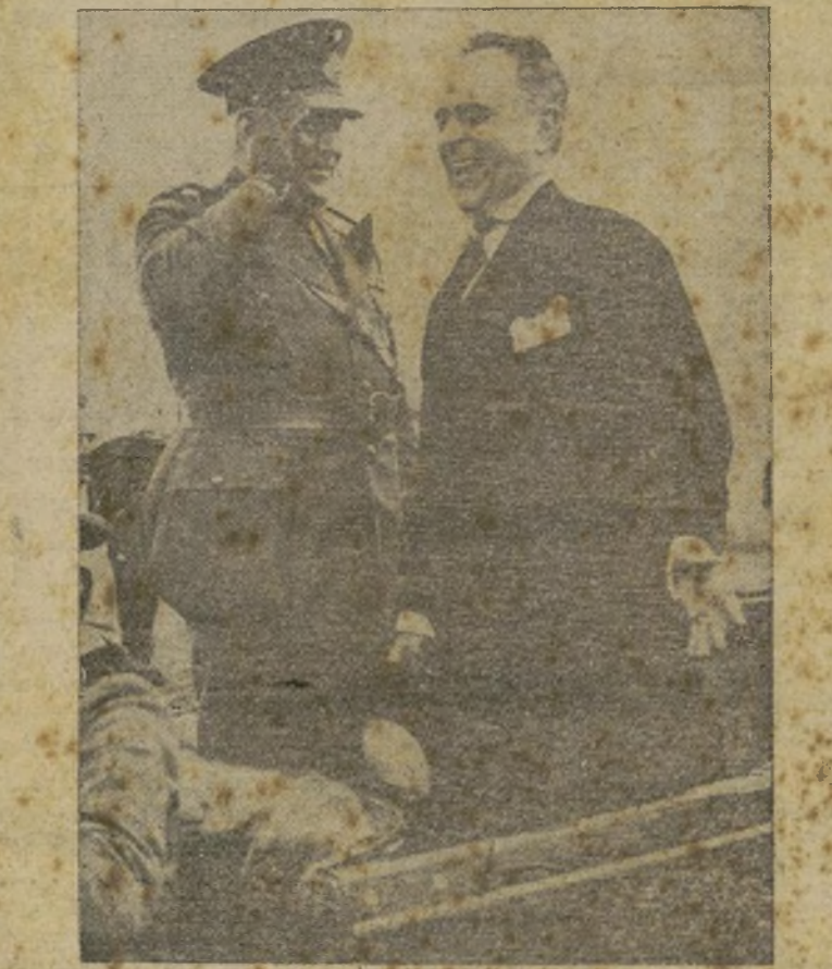
El presidente Aguirre, de la Argentina, y el presidente Getulio D. Vargas, del Brasil, en la reciente inauguración de las obras del puente internacional entre Pto. de los Libres y Uruguayana, sobre el río Uruguay. Un hijo del presidente Justo y 8 jefes militares y navales argentinos perecieron cuando un avión en que regresaban de la ceremonia se estrelló en el Sur de Uruguay.