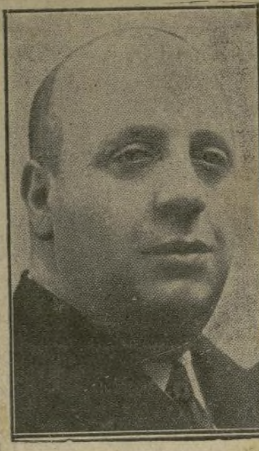
Don Indalecio Prieto

"Este jurado ha hecho el trabajo de dos jurados que trabajan normalmente, durante cinco meses, y a pesar de esto muchas veces el Fiscal necesitaba aún que le diéramos más tiempo, lo cual no siempre nos fué posible." Este informe estaba firmado por