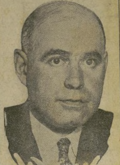
Gobernador Herbert H. Lehman

Dice que esto hará posible que lleven a cabo su programa de legislación social.—Farley dice que Roosevelt y Lehman obtendrán gran mayoría en el estado de Nueva York.